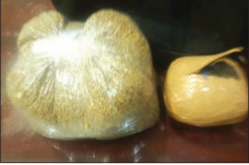
رجال الجمارك أحالوا المخدرات إلى المكافحة