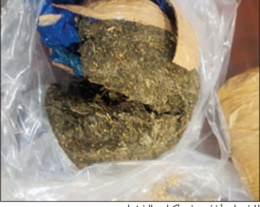
المخدرات أخفيت في أكياس الخضار