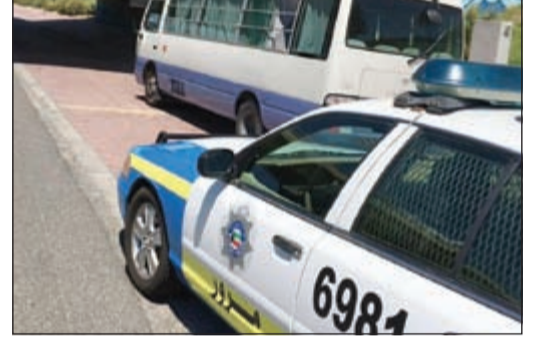
الدوريات تحيط بالباص