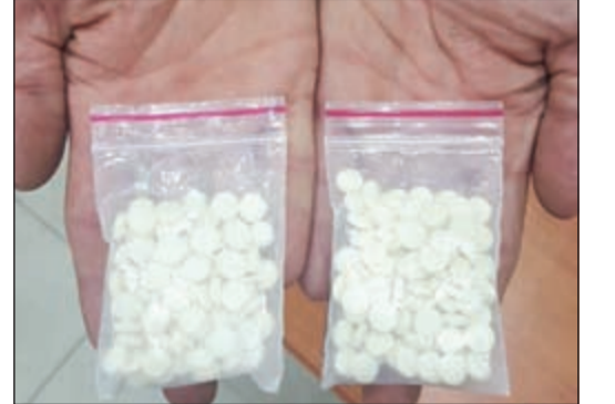
الحبوب المضبوطة مع الخليجي