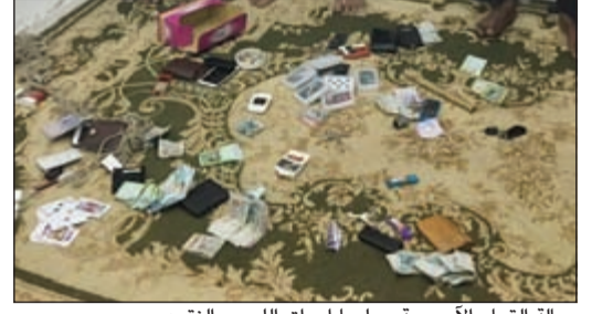
صالة القمار الآسيوية وعليها أوراق اللعب والتفوق