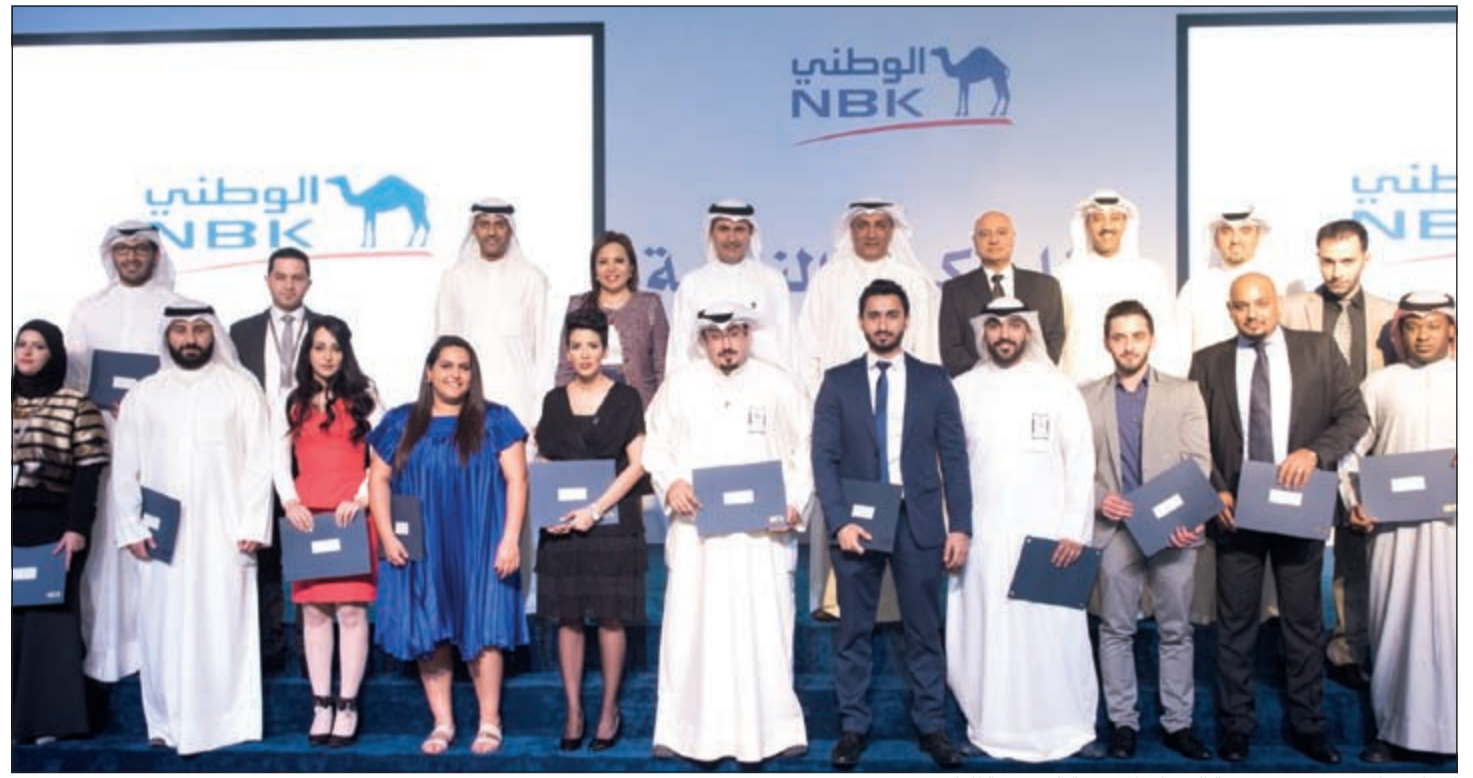
الموظفون المتميزون من مجموعة الخدمات المصرفية الشخصية للعام 2015

أعلنت زين الشركة الرائدة في تقديم خدمات الاتصالات المنقولة في الكويت عن شراكاتها الاستراتيجية لمبادرة REUSE المتكررة للمرة السادسة، وهي المبادرة الخاصة بالتوعية في المجالات البيئية، والتي تستهدف من خلالها إعادة استخدام المخلفات والنفايات بشكل مبتكر وتفاعلي مع الجمهور في دار الآثار الإسلامية وحديقة الشهيد. وذكرت الشركة في بيان صحافي أن رعايتها لهذه المبادرة المتكررة طوال السنوات الماضية أتت من منطلق استراتيجيتها تجاه قطاع البيئة، والتي تركز على سلسلة من المبادرات التي تخدم مجالات البيئة المختلفة باعتبارها قضية في غاية الأهمية في حياة المجتمع، مبيئة أن رسالتها الاجتماعية تسعى إلى الحفاظ على الموارد الطبيعية وتعزيز الإدراك بأهمية الوعي البيئي للمجتمع. وبينت زين تعدد من المؤسسات المهتمة بمجالات الاستدامة والمسؤولية الاجتماعية أنها سعت من خلال هذا الحدث الفريد من نوعه