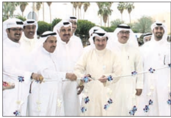
جانب من فعاليات المعرض برعاية «بيتك»

وقد عقد معرض «صناع الاقتصاد وفرص العمل» تحت رعاية وزير الإعلام والدولة لشؤون الشباب الشيخ سلمان الحمود، وبرعاية ماسية من «بيتك» بهدف مواصلة تحقيق رسالة دعم وتأهيل الكوادر الوطنية للعمل في القطاعات المختلفة من خلال إتاحة الفرصة أمام الجهات المشاركة لتقديم عدد كبير من الفرص الوظيفية في جميع المجالات بالمعرض، وتشجيع الشباب الكويتي على بناء فكرة كاملة عن العمل في هذه القطاعات قبل التخرج، وبالتالي تحديد المسار