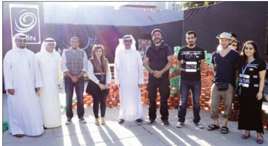
فريق «زين» خلال الفعالية

إلى إشراك الزوار بأنشطة تفاعلية بشكل يتيح لهم الفرصة للاستفادة من مجموعة كبيرة من المعلومات حول إعادة التدوير، بالإضافة لخوض تجربة صناعة أعمال فنية من مواد معاد تدويرها، مشيرة إلى أنها شهدت إقبالا كبيرا من الجمهور من جميع الأعمار وخاصة الأطفال.