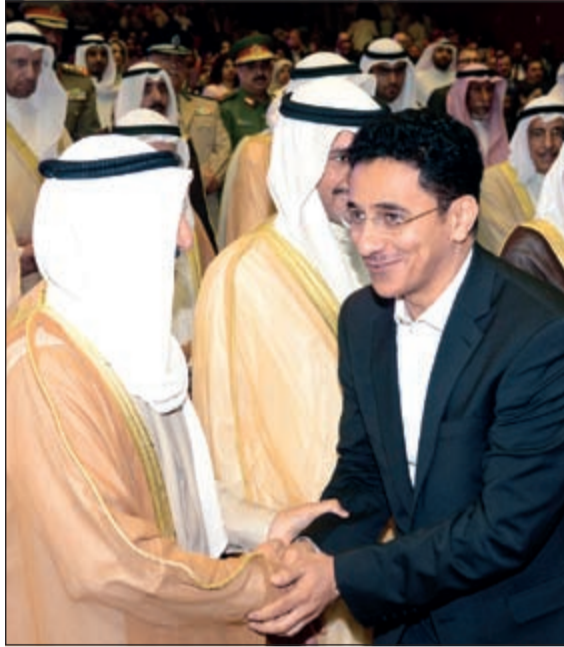
صاحب السمو الأمير مصافحا القعود خلال حضور سموه الأوبريت الوطني «البيت العود» الذي قدم العام الماضي