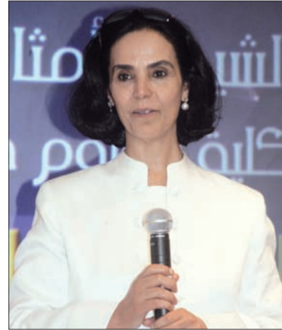
الشيخة أمثال الاحمد