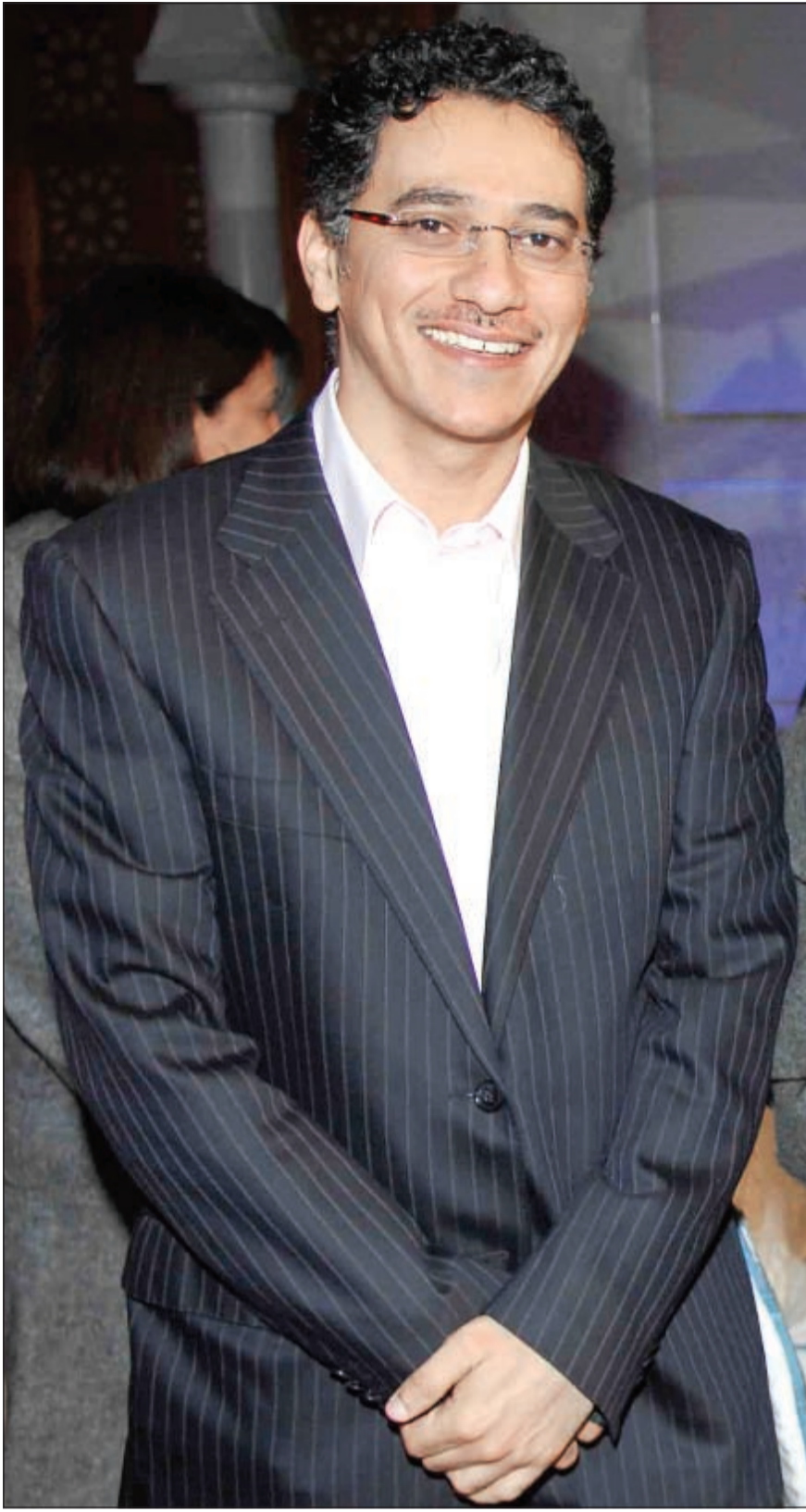
الملحن عبدالله القعود