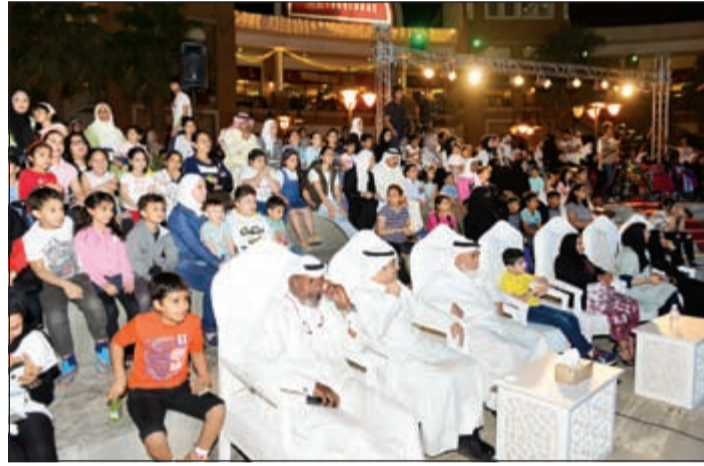
جانب من الحضور في الحفل