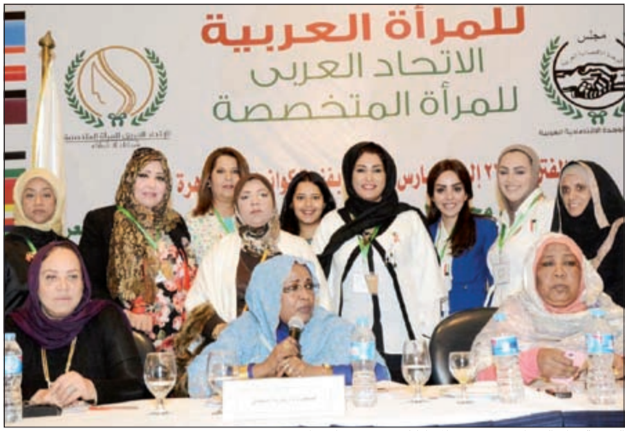
الشيخة نوال الصباح مع عدد من المشاركات في مؤتمر الاتحاد