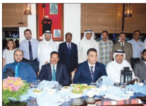
الحضور خلال حفل التكريم

من مخيمات الأمل الطبية في كل من كينيا وغانبيا والصومال وتنزانيا ومخيمي الأمل الطبيين الخامس والسادس في جمهورية جيبوتي الشقيقة عامي 2014 - 2015، وذلك تحقيقا لأهدافها وتمشيا مع استراتيجياتها في محاربة الفقر والجهل والمرض في قارة أفريقيا.