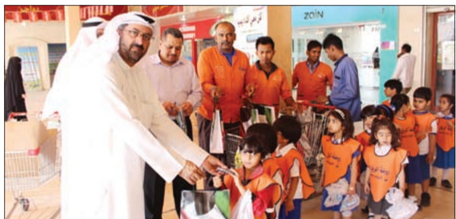
جانب من الزيارة وتوزيع الهدايا على الأطفال

وحدات المنهج التعليمي الكويتي المطور لرياض الأطفال. وأكد يعقوب أنه تم الشرح للأطفال عن السوق وما يقدمه من خدمة للمساهمين والزوار، وعمل جولة تعريفية لجميع مرافق ومكونات السوق، فحظنا على إدارة الروضة لحرصهم على تعريف أبنائنا الطلبة بأهمية السوق وما يقدمه من خدمة للأهالي والمساهمين.