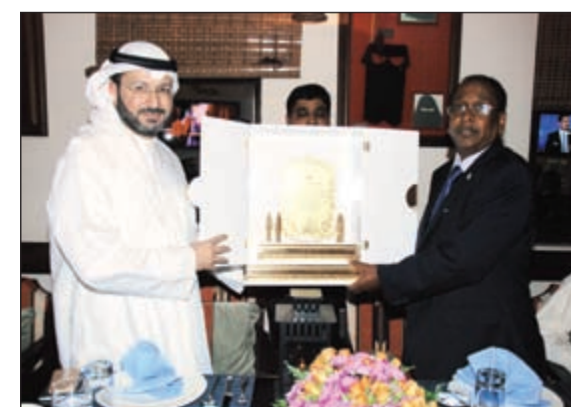
السفير محمد علي مؤمن مكرما ممثل فريق الأمل

والمحتاجين وإجراء عمليات جراحية متنوعة. حضر الحفل بالإضافة إلى أعضاء الفريق، بعض أعضاء السفارة وعدد من المدعوين وبعض ممثلي الجمعيات الخيرية في الكويت مثل الرحمة العالمية. الجدير بالذكر أن جمعية العون المباشر أقامت عددا