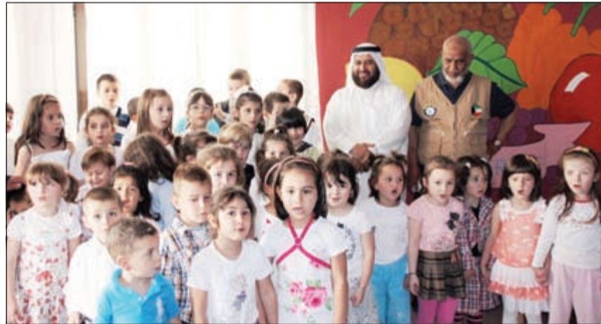
مجموعة من أيتام «النجاة» في البانيا

على دراسة أوجه الرعاية الثقافية والتربوية للأيتام في المجتمعات الإسلامية واقترح المشروعات التي تفي بتلك الاحتياجات ووضع خطط التنفيذ والتمويل، وكذلك اقتراح المشروعات ذات البعد التنموي والتي تساهم في تحسين الظروف المعيشية للأيتام، وإعداد برامج التربية الخاصة بالأيتام في المجتمعات الخارجية والأقليات المسلمة، لافتا إلى ان كفاءة الأيتام تبلغ قيمتها خارج الكويت