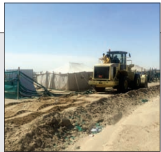
جانب من الإزالة

البلدية تزيل 15 مخيماً على طريق النويصيب في الأحمدية 07