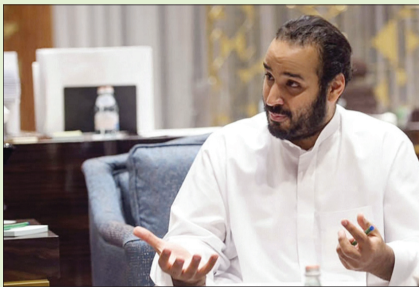
صاحب السمو الملكي الأمير محمد بن سلمان خلال حديثه لحطة «بلومبيرغ»

الصدوق قادر على شراء أكبر 4 شركات مدرجة في العالم محمد بن سلمان: تأسيس صندوق بتريليون دولار لحقبة ما بعد النفط