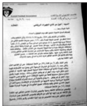
كتاب لجنة المسابقات إلى الجھراء