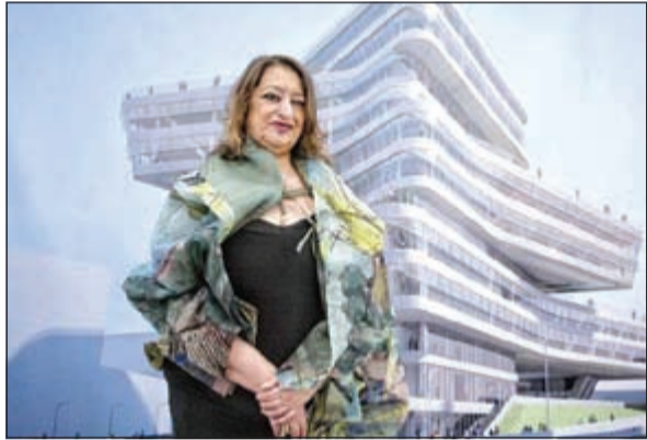
المعمارية زها حديد

وتعتبر زها حديد من ضمن أهم المهندسين المعماريين في العالم حيث نالت شهرة واسعة خاصة في المجال الرياضي، حيث برزت بتصميمها على الصعيد الدولي إذ صممت مركز انشبروك للتزلج في النمسا ودار الأوبرا في غوانغجو في الصين وكارديف في ويلز، كما قامت بتصميم حوض السباحة لدورة الألعاب الأولمبية في لندن سنة 2012 كان يفترض أن تشرف على بناء الملعب