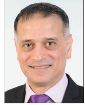
إعداد: د. طارق البكري