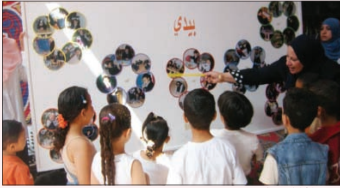
تدريس الأطفال متعة

في الكتابة للقصة والأغنية التي كنت ألحنها كي استنسخ كلماتها وأنا في المرحلة الثانوية. وبعد تخرجي في الجامعة عملت مدرسة وأحببت الطفولة المبكرة، ودفعني الأطفال للتعرف على طبيعة نموهم واحتياجاتهم، وكيفية التعامل الصحية معهم، وكان أدب الطفل خير معين لي، فمزجت الكلمة بالحسن ليتميلوا على وتر النغمات وليستوعبوا كل المعلومات.