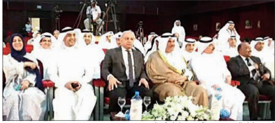
الشيخ سلمان الحمد، و. بدر العيسى يتابعان البرنامج

الأفكار التنموية والتطوير الشبابية للبرنامج في دورته الجديدة المقبلة ورعاية المهارات الطلابية التي يفرزها البرنامج بالتعاون والتنسيق مع وزارة التربية. واعرب عن سعادته بتواجده في الاحتفال بختام موسم برنامج مع الطلبة بعد عودته بحلته الجديدة في شهر أكتوبر الماضي بعد توقف دام عدة سنوات. وقال ان العلاقة والتنسيق بين وزارتي الإعلام والتربية قائمة منذ تأسيس الإذاعة والتلفزيون لما يمثلها هذان الجهازان الاعلاميان من عامل مهم في التنمية البشرية المستدامة.