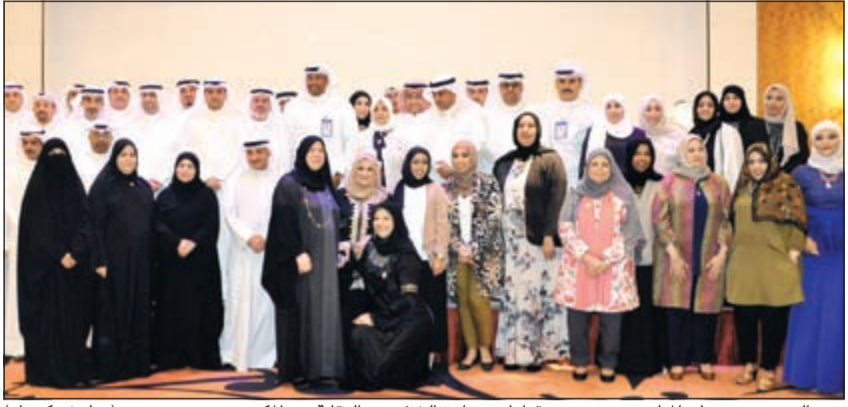
هند الصباح ود.مطر المطيري وعدد من قيادات وزارة الشؤون والنقابة مع الكرمين (ريليش كومار)

والنفسية التي تساهم في تكوين الذات. من ناحية، أكد وكيل التنمية الاجتماعية حسن كاظم الانتهاء من المرحلة الأولى في نقل ملفات حضانات الأطفال الخاصة من الشؤون إلى وزارة التربية، مشيراً إلى أنهم بانتظار رد الأخيرة للبدء في الخطوة الثانية وإجراء تسكين الموظفين لاستكمال عملية نقل تبعية الحضانات وفق قرار مجلس الوزراء. وأوضح أن نقل موظفي قسم الحضانات من عدمه متروك للموظفين أنفسهم، حيث منحوا حرية الاختيار بين النقل إلى التربية أو البقاء في الشؤون، مشيراً إلى أن هناك اجتماعاً سيحسم هذا الملف قريباً. وكشف عن تنسيق قائم بين لجنة المرأة وجهات معنية من خارج الوزارة للتعاون حول المواضيع المتعلقة بعمل اللجنة وتفعيل الدور المطلوب منها. مؤكداً أن مهام اللجنة ستتضح ملامحها في المستقبل القريب. من جهته، عبر رئيس نقابة العاملين في وزارة الشؤون يحيى الدوسري عن سعادته بالبقاء والتكريم نخبة من المديرين والمراقبين ورؤساء الأقسام العاملين بالوزارة تقديرًا وعرفانًا لعطائهم المشرف وعلمهم الجاد وتحملهم كامل المسؤولية والذين ضربوا أروع الأمثلة في العطاء غير المحدود. وتقدم الدوسري بالشكر والثناء للمديرين والمراقبين ورؤساء الأقسام المكرمين الذين بذلوا الكثير من الجهد والتفاني في العمل، مضيفاً أن ما لمسناه من تعاون مثمر وبناء بين النقابة وقيادي الوزارة وعلى رأسهم وزيرة الشؤون هند الصباح عاد بالنفع على موظفي الوزارة وأن هذه العلاقة الطيبة ساهمت في حل العديد من المشاكل والمطالب العمالية.