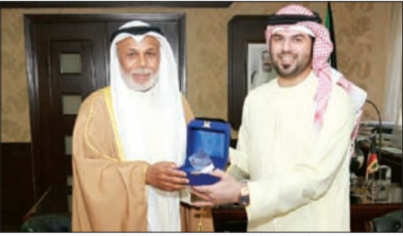
القاضي علي المدحاني مكرماً المستشار يوسف المطاوعة

التقى رئيس المجلس الأعلى للقضاء ورئيس محكمة التمييز والمحكمة الدستورية المستشار يوسف المطاوعة بمكتبه في قصر العدل أمس وفد محاكم مركز دبي المالي العالمي برئاسة القاضي علي المدحاني وبحضور مدير نيابة التمييز المستشار عبداللطيف الخنيان. وكان وفد محاكم دبي قد التقى، على صعيد هذه الزيارة التي استغرقت يومين، وزير العدل ووزير الأوقاف والشؤون الإسلامية يعقوب الصانع، الذي أكد على أهمية هذه الزيارة بين رجال القضاء والقيادات العدلية بدول مجلس التعاون الخليجي، لما في ذلك من تبادل للرؤى والأفكار والمشورة بما يخدم العمل القضائي والعدلي ويرتقي بالأداء العام للأجهزة العدلية والإطلاع على أفضل السبل لتطوير الأداء القضائي وحضر اللقاء مع الوزير الصانع وكيل وزارة العدل عبداللطيف