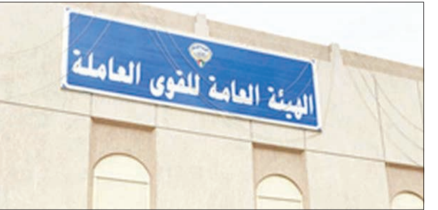
مبنى إدارة الهيئة العامة للقوى العاملة