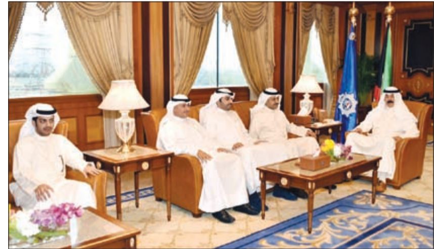
الشيخ محمد الخالد مستقبلاً وقد جمعية المحامين

استقبل نائب رئيس مجلس الوزراء وزير الداخلية الشيخ محمد الخالد في مكتبه بمقر وزارة الداخلية (مبنى نواف الأحمد)، وفداً من أعضاء مجلس إدارة جمعية المحامين الكويتية برئاسة رئيس جمعية المحامين ناصر الكريون، وعدداً من أعضاء مجلس إدارة الجمعية.