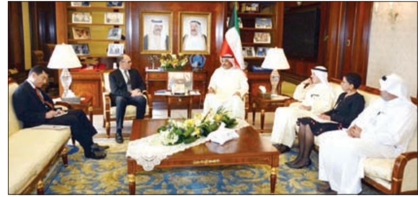
الشيخ صباح الخالد مستقبلاً السفير دوغلاس سيليمان

التقى النائب الأول لرئيس مجلس الوزراء ووزير الخارجية الشيخ صباح الخالد سفير الولايات المتحدة الأميركية الصديقة لدى البلاد دوغلاس سيليمان، حيث تم خلال اللقاء بحث عدد من الموضوعات والقضايا الإقليمية والدولية.