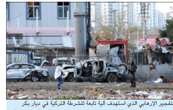
التفجير الإرهابي الذي استهدف كلية تابعة للشرطة التركية في بديار بكر جنوب شرق تركيا أمس

عشرات القتلى والجرحى من رجال الشرطة في تفجير بديار بكر التركية 20