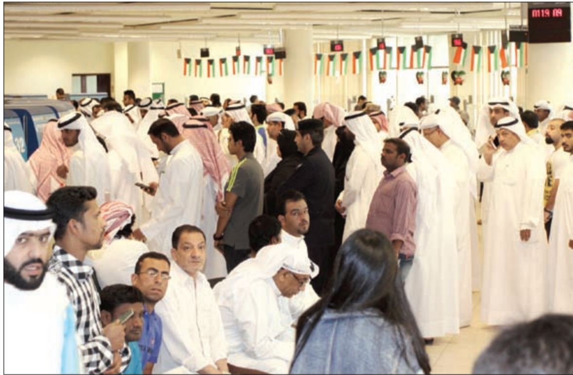
أعداد كبيرة من المراجعين تواجدت أمس في مقر هيئة المعلومات المدنية في آخر أيام الرسوم القديمة لتسلم البطاقة