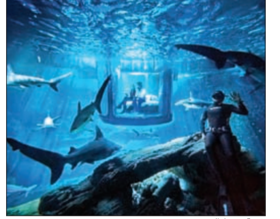
غرفة وسط القروش

باريس - رويترز: قبل أن تقرر وتختار لابد من قراءة التعليمات جيدا، فقواعد المنزل واضحة: لا سباحة ليلا.. ابقى رأسك وقدميك داخل غرفة النوم المبتكرة طوال الوقت وتجنب التحديق في الفكك المبتكرة قبل النوم مباشرة.. فقد يجعلك ذلك في مأمن بعيدا عن أسماك القرش التي تدور حول سريرك.