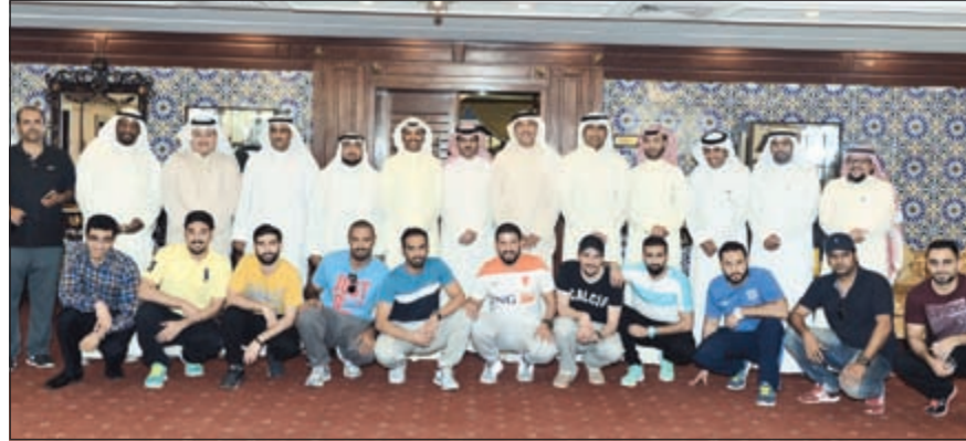
صورة جماعية للمشاركين في الاجتماع

تحت رعاية محافظ الإحمدي الشيخ فواز خالد الحمد الصباح، تنظم المحافظة بطولة التعاونيات الأولى لكرة قدم الصالات، من 11 إلى 13 أبريل المقبل في صالة نادي الشباب الرياضي، بالتعاون مع الجمعيات التعاونية والمنطقة التعليمية بالمحافظة. وعقدت اللجنة المنظمة للبطولة اجتماعاً بديوان عام محافظة الإحمدي، ضم ممثلي الجمعيات التعاونية والمنطقة التعليمية، للوقوف على آخر الاستعدادات، حيث أوضح حامد الابراهيم، مدير إدارة العلاقات الحكومية بالمحافظة ومدير عام البطولة، أن هناك اهتماماً كبيراً من قبل المحافظ بهذه البطولة باعتبارها الأولى من نوعها على مستوى محافظات الكويت. وخلال الاجتماع أقرت اللجنة المنظمة فرقة البطولة، حيث تم تقسيم المشاركين إلى مجموعتين، كل منهما تضم 7 فرق، تقام مباريات المجموعة الأولى يوم الإثنين 11 أبريل، وتشمل فرق محافظة الإحمدي وجمعيات الطهر، أبو حليفة، الفحيحيل، جابر العلي، الصباحية، وصباح الاحمد، كما مباريات المجموعة الثانية تقام يوم الثلاثاء 13 أبريل، وتشمل فرق جمعيات الإحمدي، علي صباح السالم، الفطناس،