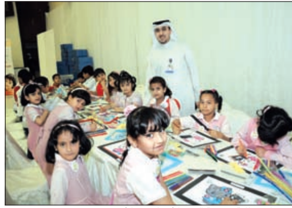
الامتيازات بنظافة وصحة الفم والأسنان في الأحمدي