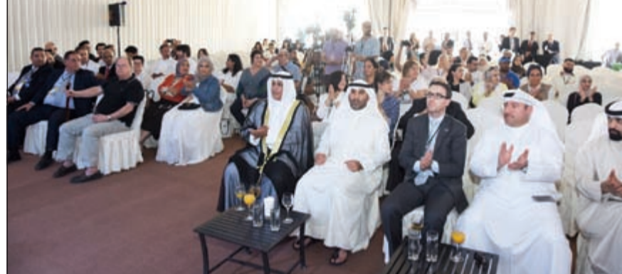
متابعة من الحضور لفقرات المهرجان