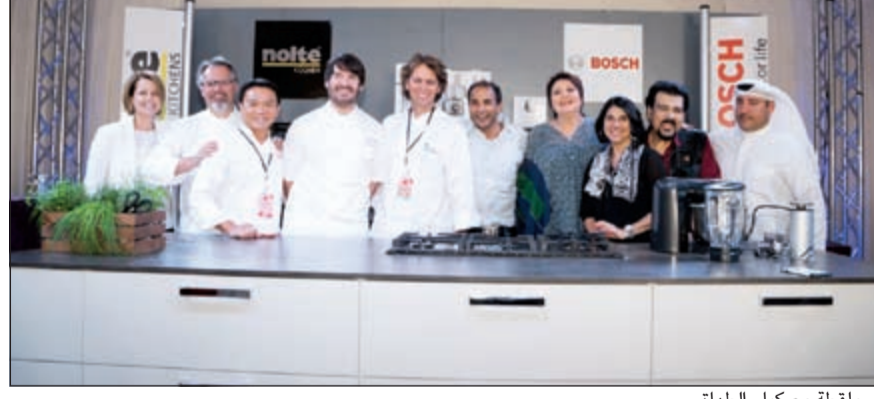
.. ولقطة مع كبار الطهاة