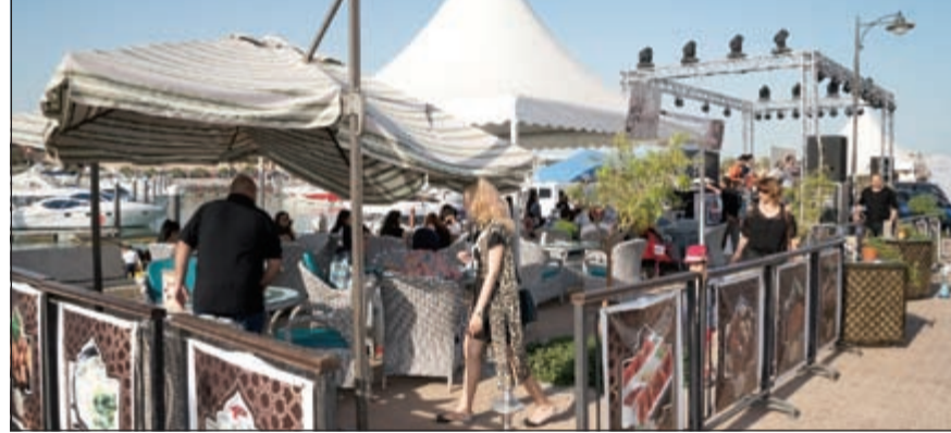
الحضور استمتعوا بأجواء المهرجان