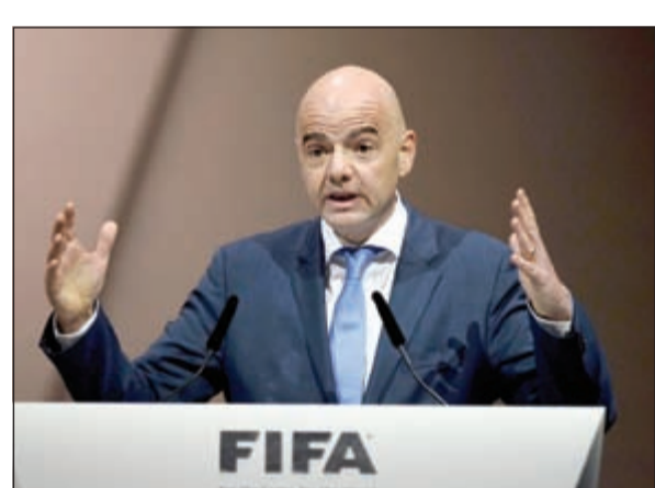
رئيس الاتحاد الدولي لكرة القدم (فيفا) جيانى إنفانتينو

وقال إنفانتينو «اقتراحي بالنسبة لأميركا الجنوبية هو وجود خمسة مقاعد ثابتة وربما يكون هناك مقعد إضافي يمكن ان تنافس عليه فرقها». ولم يكشف إنفانتينو كيفية توزيع المقاعد الثمانية أو المنافسة عليها. ولم يتم اختيار الدولة المستضيفة لنهائيات كأس العالم 2026 بينما ستقام نسخة 2018 في روسيا وستستضيف قطر نسخة 2022. وزار إنفانتينو مقر اتحاد أميركا الجنوبية في اسونسيون في باراغواي يوم الاثنين الماضي، حيث أبدى وجهة نظر مؤيدة لأن تمام النسخة الثمانية من كأس العالم في 2030 بالمشاركة بين أوروغواي والأرجنتين بعد ان خاضا أول نهائي للبطولة عام 1930. وفازت الدولتان بكأس العالم بواقع مرتين لكل منهما.