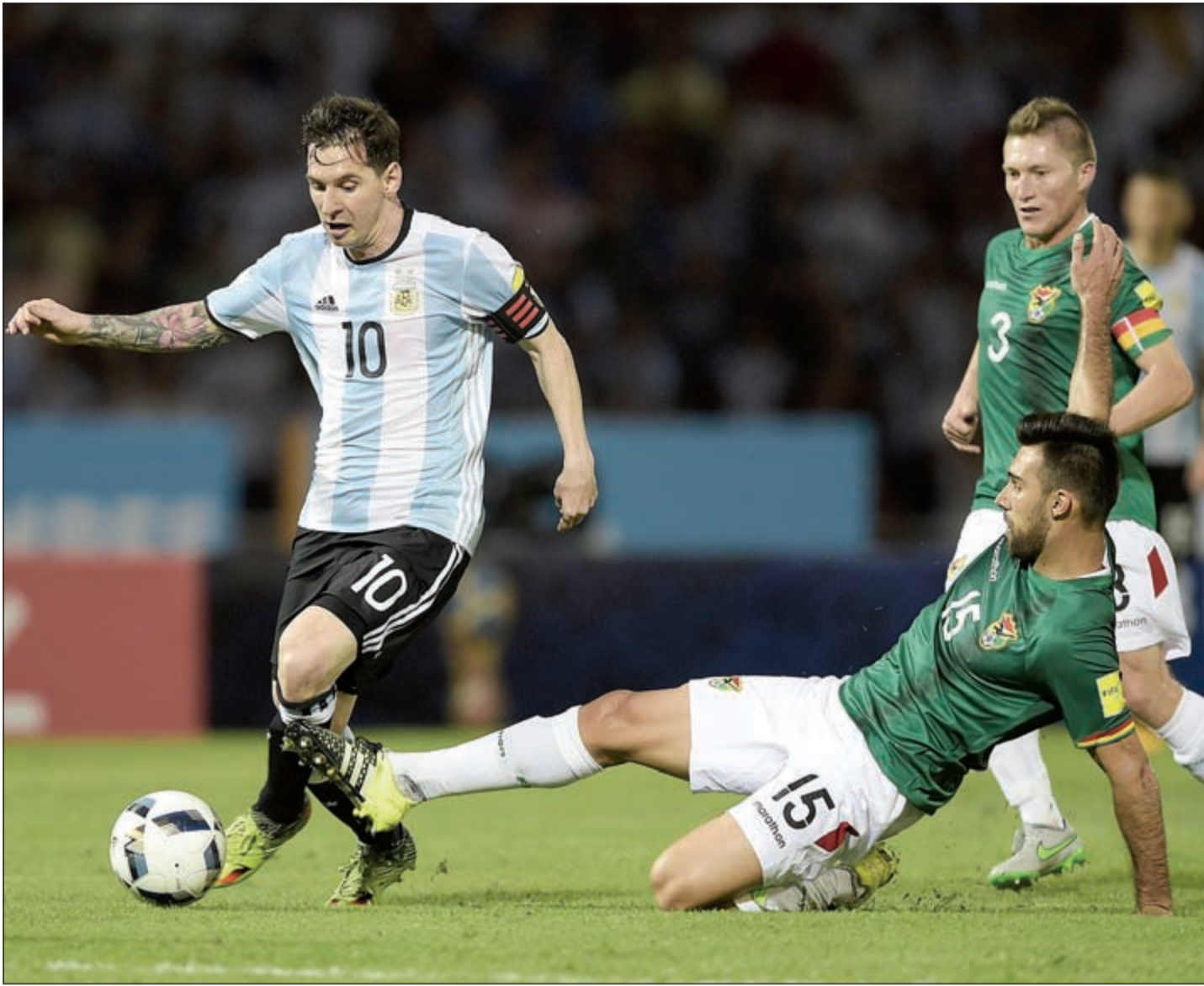
البوليفي داني بيخارانو يتدخل بقوة على نجم الأرجنتين ليونيل ميسي

افتتح داريو لبيتسكانو التسجيل لباراغواي (40). وعمقت ادغار بينيتيس جراح البرازيل بالهدف الثاني (49). وأعاد المهاجم المخضرم ريكاردو اوليفيرا الأمل إلى البرازيل، قبل أن ينقذ مدافع برشلوثة دانيال الفيش السيليساو من خسارة ثانية في التصفيات بإدراكه التعادل في الدقيقة الثانية من الوقت بدل الضائع.