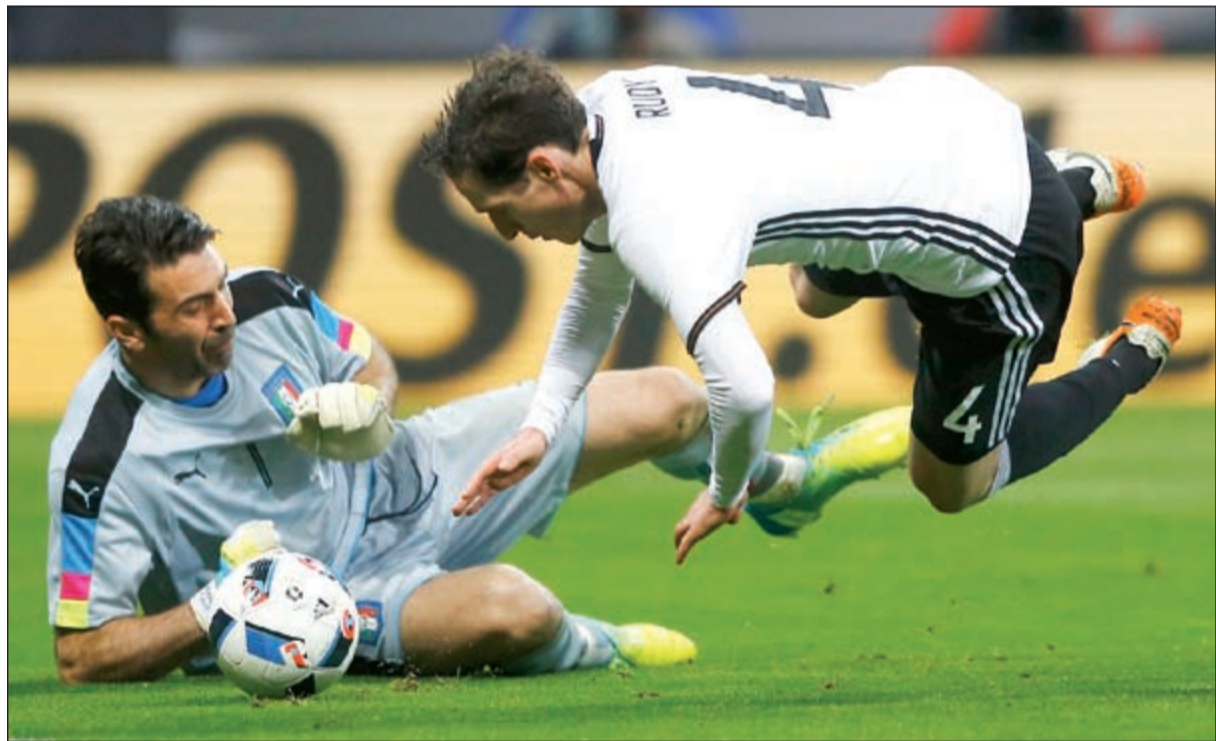
حارس إيطاليا بوفون تسبب في ركلة جزاء

وفازت البرتغال على ضيفتها بلجيكا 2-1. وتعادلت أيرلندا مع ضيفتها سلوفاكيا 2-2. وخسرت استونيا أمام ضيفتها صربيا 0-1. كما خسرت مقدونيا أمام ضيفتها بلغاريا 0-2. وتعادلت السويد مع ضيفتها تشيكيا 1-1. وخسرت سويسرا أمام ضيفتها البوسنة 0-3. وتعادلت جورجيا مع ضيفتها كازاخستان 1-1. وفازت النرويج على ضيفتها فنلندا 2-0. وخسرت لوكسمبورغ أمام ضيفتها ألبانيا 0-2. وخسرت النمسا أمام ضيفتها تركيا 1-2.