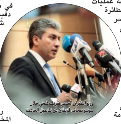
وزير الطيران المدني شريف فتحي خلال مؤتمر صحفي للأطراف عن تفاصيل الحادث

في تمام التاسعة و15 دقيقة صباحاً، أعلنت شركة مصر للطيران أن المفاوضات مع جميع ركاب الطائرة قُبلت، فبدأت الطائرة وأربعة أجانب.. بعدها عرض التلفزيون المصري لحظة الإفراج عن ركاب الطائرة المصرية المختطفة.