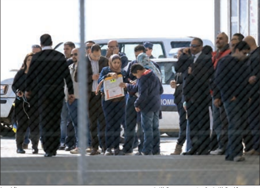
جزء من ركاب الطائرة عقب تحريرهم من الطائرة