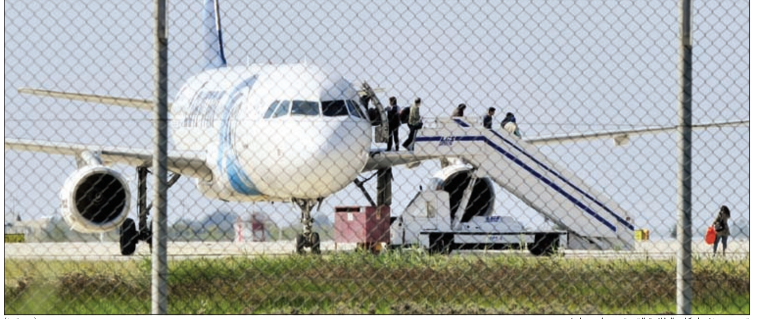
تحرير جزئي لركاب الطائرة التي تمت على مراحل