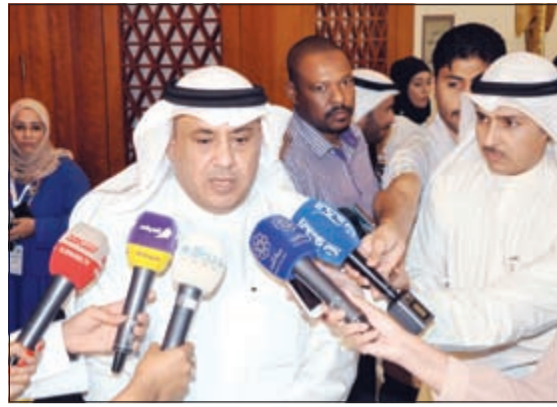
د.مطر المطيري يتحدث إلى الصحفيين