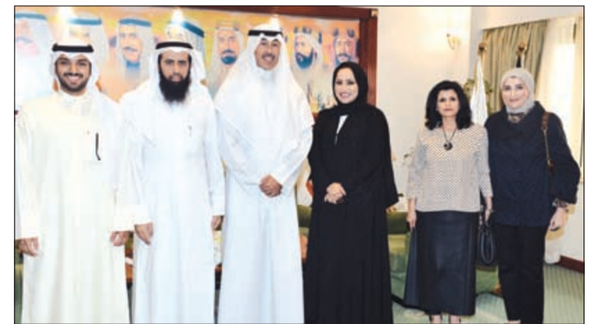
الشيخ فواز الخالد مستقبلاً رئيس وأعضاء الجمعية الكويتية للإعاقة السمعية

جدد محافظ الأحمدى الشيخ فواز الخالد دعوته إلى مؤسسات الكويت لبذل أقصى جهد ممكن ليحصل المواطنون والمقيمون، على الخدمات المختلفة في أماكن إقامتهم، لتوفير الوقت والجهد اللذين وصل عددهم إلى نحو تسعة آلاف شخص على مستوى الكويت، لافتاً إلى أن أولى تلك الاحتياجات هي مقر دائم للجمعية، حتى تقوم بدورها المنوط بها داخل المجتمع الكويتي، موضحاً أن الجمعية لن تستطيع حل كافة المشكلات التي تواجه ذوي الإعاقة السمعية إلا بعد أن يتوافق لها الدعم اللازم.