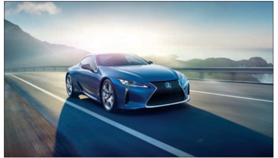
لكزس LC مايبيرد.. التصميم الملهم

متعة اكتشاف المجهول. ولذلك، فإنني أعتزم التعبير عن هذا المفهوم من خلال تجربة التذوق». «التوقعات» أيضا الموضوع الذي تدور حوله نسخة هذا العام من «جائزة لكزس للتصميم»، المسابقة العالمية التي تهدف إلى تعزيز تطوير ورعاية الأفكار الإبداعية التي تسهم في الارتقاء بالمجتمع من خلال دعم الجيل الجديد من الشباب الموهوبين لمستقبل أفضل. كما سيتم عرض الأعمال الإبداعية للمتاهلين الـ 12 لجائزة لكزس للتصميم 2016 في جناح لكزس خلال «أسبوع ميلانو للتصميم».