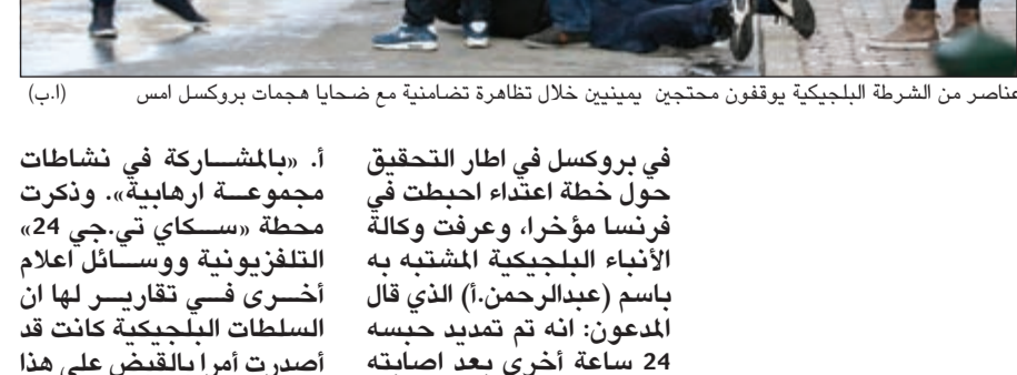
عناصر من الشرطة البلجيكية يوقفون محتجين يمينيين خلال تظاهرة تضامنية مع ضحايا هجمات بروكسل أمس