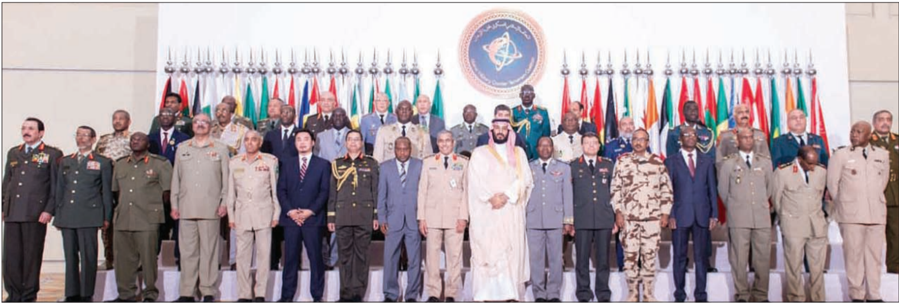
صاحب السمو الملكي الأمير محمد بن سلمان ولي ولي العهد النائب الثاني لرئيس مجلس الوزراء وزير الدفاع السعودي في صورة جماعية مع رؤساء أركان دول «التحالف الإسلامي» في الرياض أمس (واس)

وأوضح عسيري أن مهمة مركز التحالف هي تقريب وجهات النظر وتفادي الخلافات، لافتاً إلى أن دول العالم الإسلامي مجمعة على تعريف الإرهاب فكرياً وأمينياً.