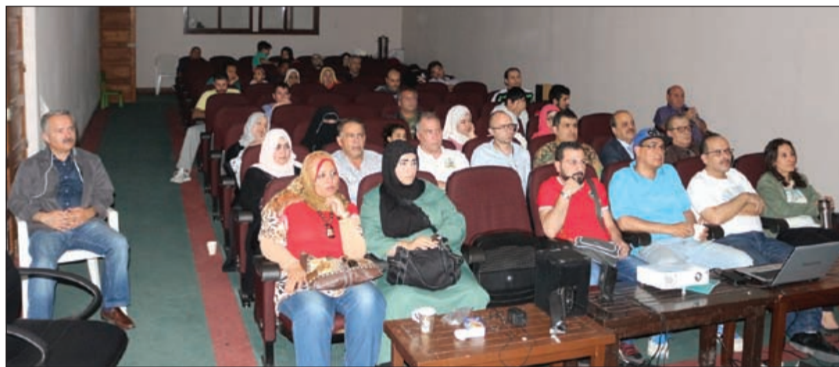
جانب من الحضور في المدرسة القبلية

غلاس ثم غدر به وبابنه رفيق رحلته، كانت الرسالة الأساسية التي تعطي الناس أملا في استكمال طريقهم وأن كان للقصاص».