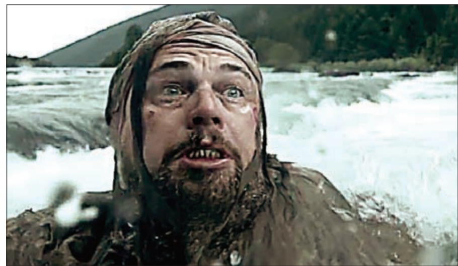
مشهد من «العائد من الموت»

هل يستحق الانتقام كل هذا الصبر وكل هذه المعاناة؟! سؤال يمين على أذهان كثير من المشاهدين الذين حضروا ختام شهرية الأوسكار الأولى التي نظمتها استوديو الأربعة بالمدرسة القبلية، حيث عرض فيلم «العائد من الموت» الحائز على أوسكار أفضل مخرج وأوسكار أفضل ممثل. طالبت المعاناة الحضور الذين وقعوا فريسة لمشاهد دموية وعنق وحشي على مدى أغلب أوقات الفيلم الممتد لـ 156 دقيقة، ولم تنجح الاستراحة الذي نصفت الفيلم في محو هذه الآثار وان كانت براعة المخرج أليخاندرو غونزاليز إيناريتو في الإمساك بأدق التفاصيل عبر حبكة وتصوير متقنين