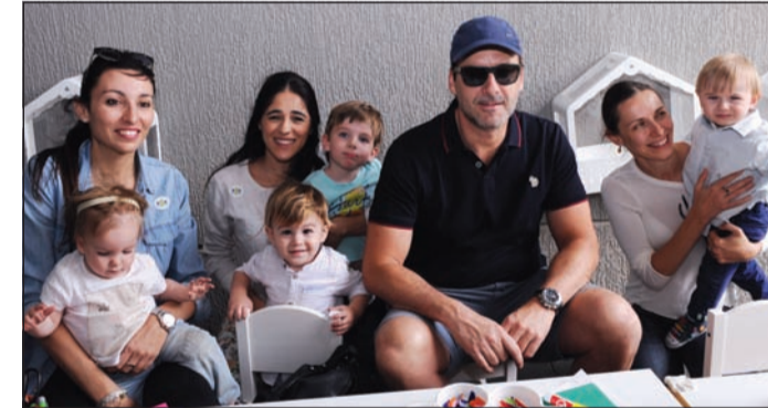
السفير البلجيكي أندي ديتاي وعائلته وبعض الأصدقاء

اتجه الأطفال إلى اللعب الداخلي لتسقط من اللعب والحركة لتعارف الأهيات للتعرف وتبادل الخبرات بما يفيد رعاية الأطفال وتنميتهم. في ختام الحفل، قامت د.حنان المطوع من مؤسسة الملكة البريطانية للتعليم المبكر، بتقطيع قالب