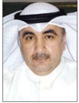
م. فيصل الحساوي

الرياض-كونا: كشف مدير عام الهيئة العامة للزراعة والثروة السمكية م. فيصل الحساوي عن مقترح كويتي لتوحيد فترة حظر صيد الريبان في كل من الكويت والسعودية والبحرين.