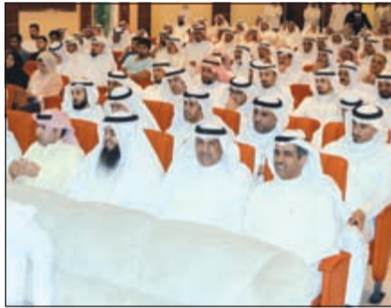
جانب من المهرجان الخطابي