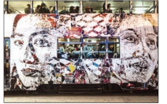
أحدى اللوحات للفنان البرتغالي

البرتغال - سي إن إن: يعتبر الفنان الشاب ألكساندرو فار تو، أو «فيلن»، جدران الشوارع مصدراً للإلهام، فهي بنظر هذا الفنان «شاهد» على التاريخ، تراقب كل ما يحدث أمامها. ويقول الفنان البرتغالي الشاب: «أرى كيف تغطي الجدران أحياناً الملصقات الفوضوية... أجد هذه الملصقات جميلة لأنها تبث طاقة لا يستطيع أحد أن يسيطر عليها».