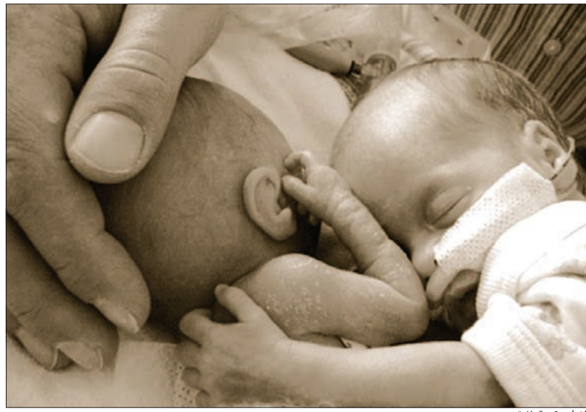
التوأم وقت الولادة