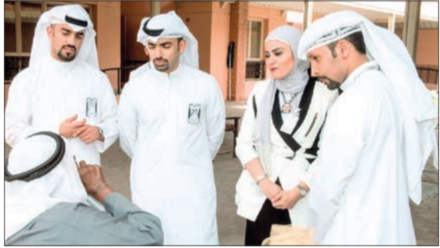
موظفو «الوطني» خلال الزيارة

ونتمنى إليه، وسيواصل البنك تعاونه ودعمه لمختلف الجهات الاجتماعية والإنسانية بموازة إطلاق المبادرات الهادفة الى الارتقاء بالمجتمع وتنمية أفراده ومؤسساته.