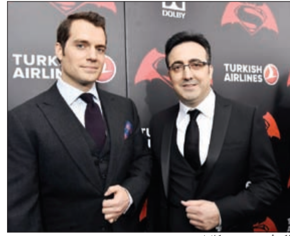
إلكر أيجي وهنري كافيل

ويتضمن الفيلم أحد المشاهد الأساسية على متن طائرة الخطوط الجوية التركية طراز 777، كما شارك نجما الفيلم بن أفليك الذي يلعب دور باتمان وجيسي آيزنبرج الذي يلعب دور القبط العالمي لكس لوثر، في إعلان خاص حول أحدث وجهتين للخطوط الجوية التركية وهما مدينتا غوثام سيتي ومرتوبوليس.