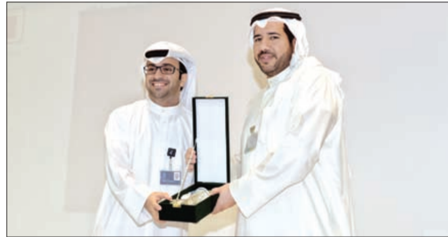
الشيخ عبدالله الحمود يكرم «زين»

والتي تهدف إلى تعزيز الإدراك بأهمية الوعي البيئي في المجتمع من خلال تعريف الأفراد والمؤسسات بقانون البيئة الجديد وحثهم على تطبيق الاشتراطات البيئية التي من شأنها الحفاظ على البيئة المتعلقة بالمياه. تتماشى تماما مع استراتيجية زين للمسؤولية الاجتماعية والاستدامة تجاه القطاع البيئي.