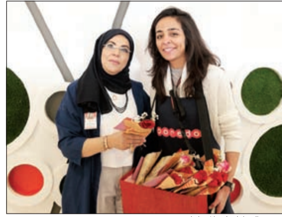
توزيع الهدايا على الموظفات