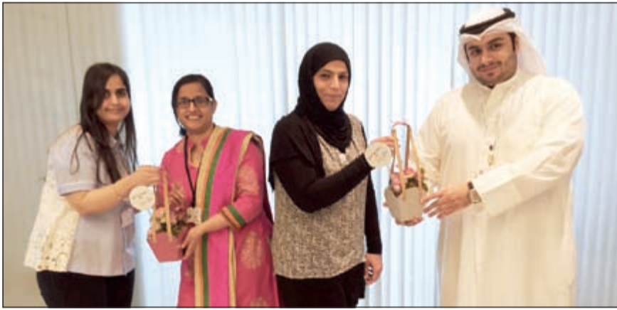
جانب من تكريم الأمهات في عيد الأم

والسعي إلى رد جزء يسير منجميل والدين المستحقين لها في أعناق الأبناء، مؤكداً أن الولاء للأم والإحسان إليها حياتها من أجل راحته وسعادته، داعياً الموظفين إلى الحرص على بر والوالدين