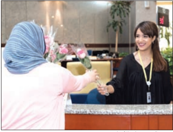
توزيع الزهور على الأمهات في عيدهن