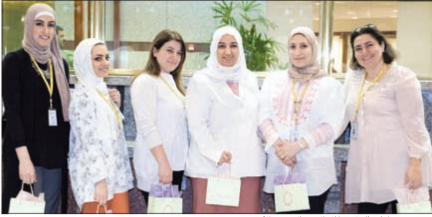
عدد من موظفات البنك خلال الاحتفال بعيد الأم

من إيمان البنك الراسخ بأهمية مشاركة موظفيه وعملائه فرحة الأعياد والمناسبات الوطنية والاجتماعية من خلال مبادرات بسيطة نابغة من القلب.