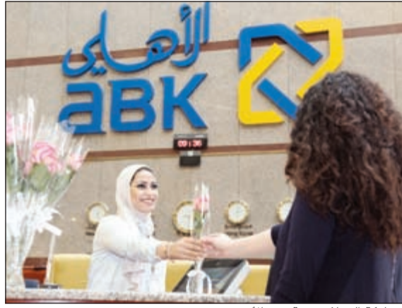
مشاركة العملاء فرحة عيد الأم