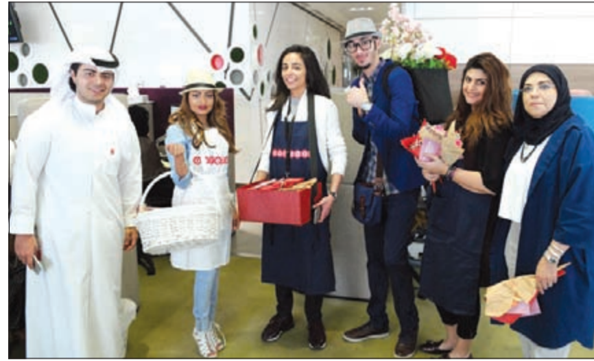
الفريق المشارك في تكريم الأمهات في عيدهن

خلال مبادراتنا، بهدف دعم وتطوير وتنمية تلك المشاريع والمساهمة في بناء مستقبل هؤلاء الشباب». وعلى نطاق الشركة، احتفلت Ooredoo بموظفاتنا بمناسبة عيد الأم، من خلال توزيع الزهور على الأمهات العاملات في المبني الرئيسي للشركة وجميع الفروع، تعبيراً عن تقدير الشركة لجهودهن المبذولة داخل الشركة، والدور الفاعل الذي يلعبه في بناء وتطوير المجتمع.