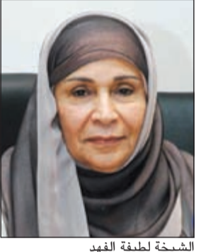
الشيخة لطيفة الفهد

وأشارت الى ان الاجتماعات شددت على ضرورة وجود ارادة سياسية في مختلف الدول لتعزيز دور المرأة وإشراكها في تنفيذ خطط التنمية موضحة ان الكويت كانت سباقة في هذا المجال.