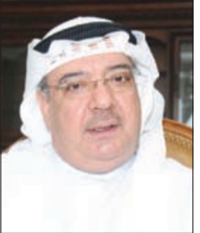
السفير عبدالحمد الفيلاكاوي

واشنطن - كونا: أشاد سفراء دول مجلس التعاون الخليجي لدى كندا بالجهود التي تقوم بها أوتأوا في استقبال اللاجئين السوريين الذين وصل عددهم في البلاد إلى 25 ألف شخص. وقال سفيرنا لدى كندا عبدالحمد الفيلاكاوي في بيان صحافي أمس ان السفراء الخليجين أعربوا عن «الشكر والعرفان» للحكومة الكندية في حفل أقيم مساء أمس الالوم واللاجئين والمواطنة الكندي جون مكالوم ووزير الخارجية الكندي ستيفان ديون وعمدة العاصمة الكندية أوتاوا جيم واتسون الذي تسلم بدوره تبرعا رمزيا لصالح استقبال اللاجئين السوريين ورعايتهم وتوطينهم في المدينة. وأشاد السفير الفيلاكاوي بالجهود الكندية «المحمودة