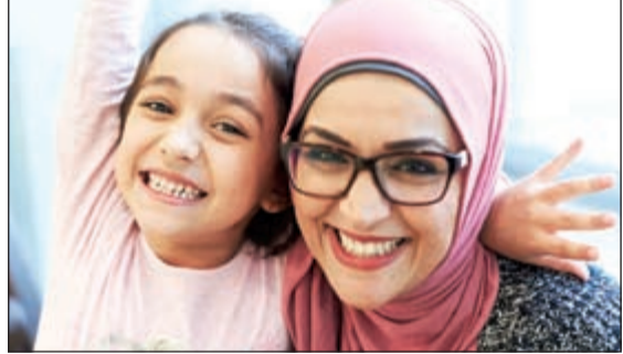
العناية بالأسنان توفر لطفلك الثقة والسعادة

أو بسبب تناول الأدوية. وقد تسبب صعوبة تناول الطعام لدى الصغار، نتيجة لآلام الأسنان، بظهور خسارة في الوزن، وفشل في النمو، وربما يتعرض الذين يعانون من اضطرابات استقلابية منهم لعواقب وخيمة. وأما الصغار الذين يخافون من إجراء عمليات الأسنان، والذين يحتاجون إلى علاج شامل يتطلب خضوعهم لتخدير عام، فقد يكونون في خطر ضمن ظروف صحية معينة.