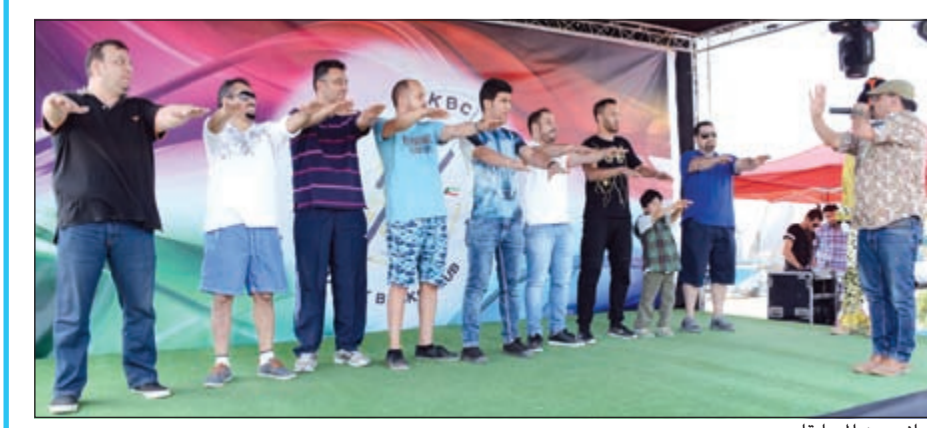
جانب من المسابقات