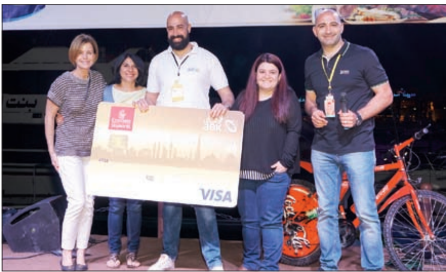
الفائزون في السحب الذي تم إجراؤه خلال المهرجان