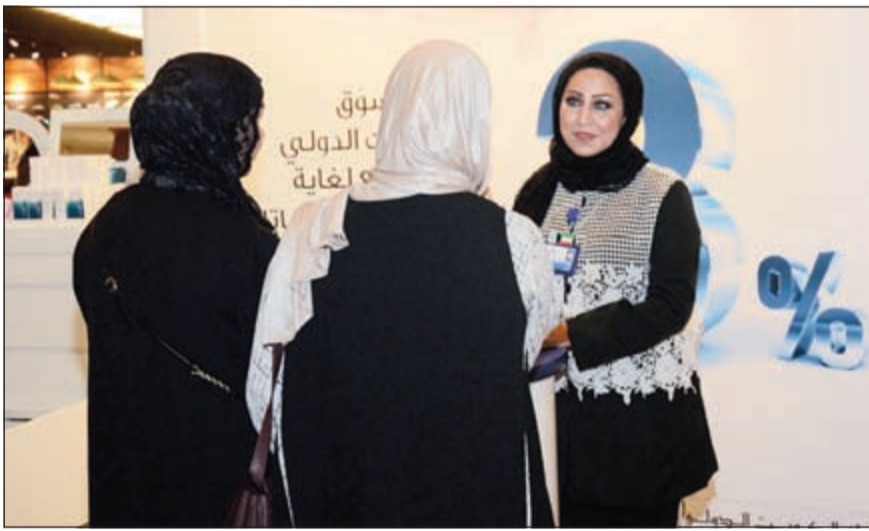
جناح «الدولي» في المعرض

أعلن بنك الكويت الدولي عن رعايته لمعرض «هلا رمضان» الذي أقيم في مول 360 من 19 إلى 24 مارس 2016، بمشاركة مجموعة من الشباب الكويتي من أصحاب المشاريع الصغيرة الإبداعية الذين عرضوا مجموعة من منتجاتهم ومشاريعهم ومن بينها مستلزمات شهر رمضان الفضيل.