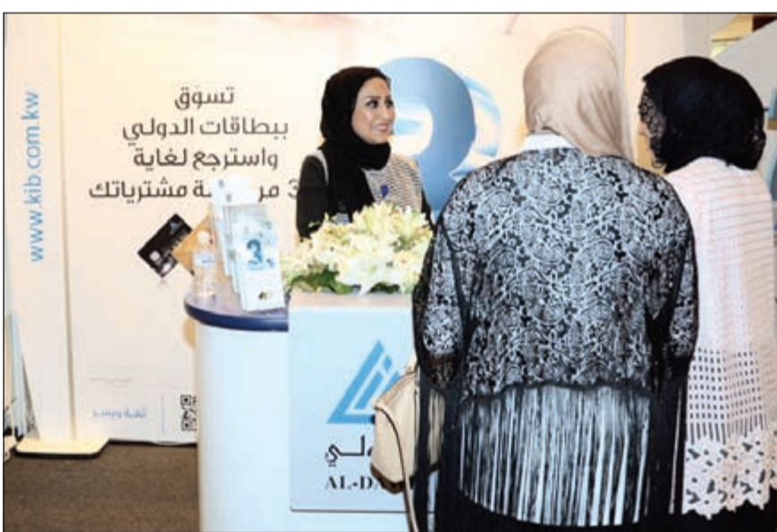
«الدولي» يقدم خدماته لزوار مول 360

معد وقت تنظيمها، والذي جاء متزامنا مع قرب حلول شهر رمضان الفضيل وحاجة الناس لارتياح وزيارة مثل هذه المعارض الموسمية المتخصصة بالاحتياجات الرضائية.