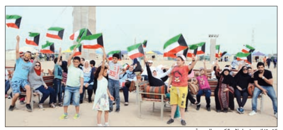
الاحتفال برفع إعلام الكويت الحبيبة