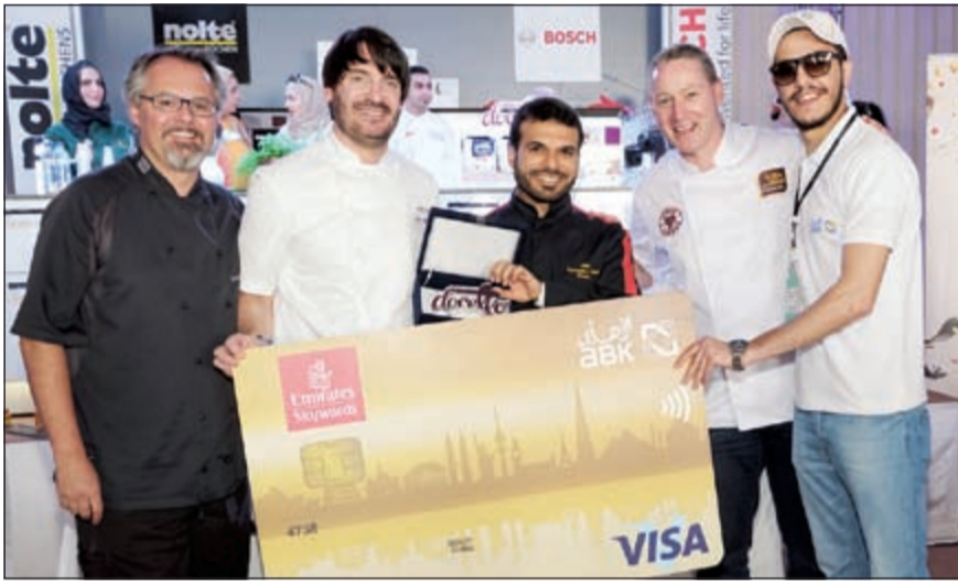
جانب من تكريم الفائزين في السحب خلال المهرجان

أعلن البنك الأهلي الكويتي عن رعايته لمهرجان المأكولات Q8 Taste of، بنجاح، للعام الثاني على التوالي، حيث أقيم المهرجان في مارينا كرسنت من الفترة 17 إلى 19 مارس 2016. وخلال المهرجان قام البنك بتقديم جوائز قيمة للفائزين في السحب الذي تم إجراؤه وهي عبارة عن بطاقات فيزا الذهبية للمسافر المسددة بقيمة كل منها 100 دينار. وسلط المهرجان، الذي أقيم على مدار 3 أيام، الضوء على الأطباق المتنوعة والموائد العامة بالمأكولات الشهية في المجتمع الكويتي، وأتاح للزوار فرصة تذوق الأطعمة التي قدمها مختلف الطهاة والمطاعم والمخابز والاستمتاع بتجربة الطهي الحي على يد أشهر الطهاة المرموقين. كما تضمنت المهرجان فقرات ترفيهية وألعابا للأطفال ومكانا مخصصا للستضافة والزوار.