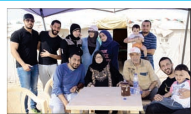
مشاركة عائلية في اليوم المتوح