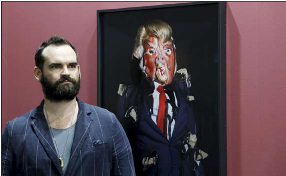
الفنان جيمس أوسترر أمام اللوحة التي رسمها دونالد ترامب

العام، مرجح فوز كلينتون بالرئاسة الأميركية. وأظهر الاستطلاع الذي أجرته شبكة «سي.ان.ان» من 56٪ من الأميركيين يرون ان كلينتون ستفوز على ترامب في حال تواجها معا في الانتخابات الرئاسية المقبلة، مقابل 42٪ قالوا ان ترامب سيقتدم. وأوضح غالبية المستطلعة آراهم أن سبب تفضيلهم كلينتون على ترامب، يرجع الى اعتقادهم بأنها تملك المهارات والخبرات الأفضل لتحقيق مصالح الولايات المتحدة بوصفها وزيرة خارجية سابقة.