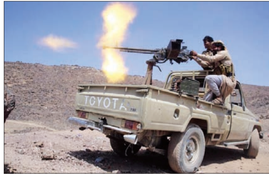
عناصر من المقاومة الشعبية خلال مواجهات عنيفة ضد المتمردين شرق صنعاء أمس الأول (أياد أحمد)