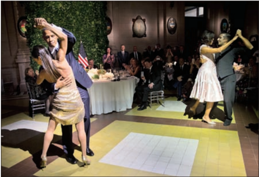
الرئيس باراك أوباما وقريته ميشيل يرقصان التانغو في الأرجنتين أمس الأول

منها العمل على الحد من الانبعاثات الكربونية الناتجة عن الرحلات الجوية مع الربط الكهربائي مع شبكات الطاقة الشمسية وطاقة الرياح. وقال البيت الأبيض «ستتعاون الحكومتان لتعزيز مصادر الطاقة المتجددة من خلال المساعدة الأميركية لإصلاح السوق وتغذية قدرات الشبكات وضخ الطاقة المتجددة إلى شبكة القوى الكهربائية». وكان أوباما قد شارك في رقصة تانغو مع راقصة أرجنتينية شهيرة خلال مأدبة العشاء الرسمية المقامة على شرفه في بوينس آيرس مساء أمس الأول.