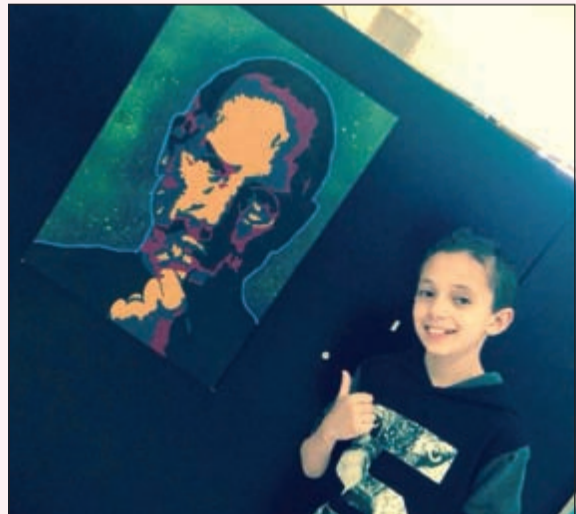
محبب كثيراً باستيفان جوبز

المعلمين طيبة وعن هواياته يقول: القراءة والرسم وكرة القدم ومتابعة كل جديد في عالم التكنولوجيا ومشاهدة مباريات المصارعة الحرة، وأشارك في حلقات حفظ القرآن الكريم بمسجد الصانع وأفوز بالمسابقات التي تنظمها مؤسسة الصانع التعليمية جراًهم الله خيراً. وأمارس هواية كرة القدم ضمن فريق الصف في المدرسة ومع زملائي وأصدقائي في المساء، وأبرع في برمجة واصلاح الأجهزة الإلكترونية والذكية وخاصة أجهزة iPhone-Ipad-iPod وأقوم بقيادة الفرقة الموسيقية بالمدرسة وأنا مشارك في مشروع تحدي القراءة العربي الذي يهدف إلى توسيع مدارك النشء وغرس حب القراءة في نفوسهم والقراءة منذ الصغر ويقوم المتسابق بقراءة 50 كتاباً من عيون الأدب العربي. وقال إنه معجب جداً بالمخترع العالمي ستيفن بول جوبز المؤسس الشريك والمدير التنفيذي السابق ثم رئيس مجلس إدارة شركة (أبل) وهو أيضاً الرئيس التنفيذي السابق لشركة بيكسار والعضو في مجلس إدارة شركة (والت ديزني) بعد ذلك وحتى وفاته، ويقول مصطفى أنه أثناء إدارته للشركة استطاع جوبز أن يخرج للنور كلاً من جهاز الماكنتوش (ماك) بأنواعه وثلاثة من الأجهزة المحمولة وهم (آيبود و(آيفون) و(آي باد).