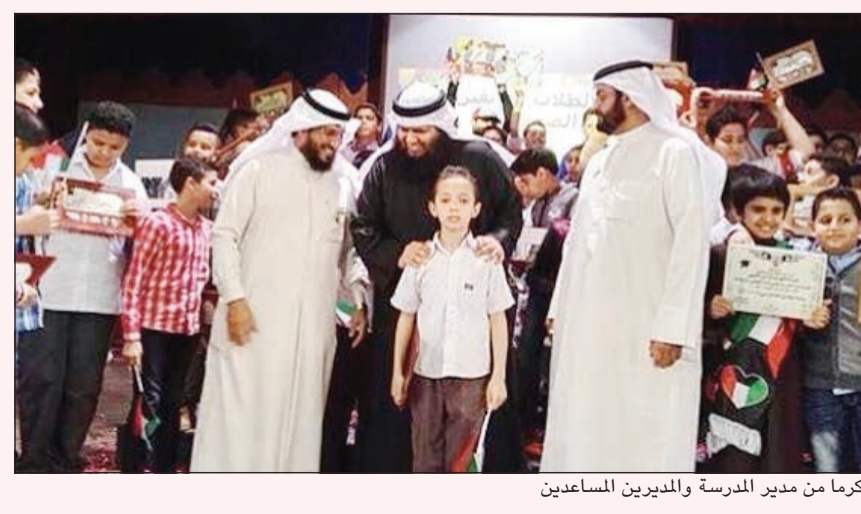
مكرماً من مدير المدرسة والمديرين المساعدين

المعلمين طيبة وعن هواياته يقول: القراءة والرسم وكرة القدم ومتابعة كل جديد في عالم التكنولوجيا ومشاهدة مباريات المصارعة الحرة، وأشارك في حلقات حفظ القرآن الكريم بمسجد الصانع وأفوز بالمسابقات التي تنظمها مؤسسة الصانع التعليمية جراًهم الله خيراً. وأمارس هواية كرة القدم ضمن فريق الصف في المدرسة ومع زملائي وأصدقائي في المساء، وأبرع في برمجة واصلاح الأجهزة الإلكترونية والذكية وخاصة أجهزة iPhone-Ipad-iPod وأقوم بقيادة الفرقة الموسيقية بالمدرسة وأنا مشارك في مشروع تحدي القراءة العربي الذي يهدف إلى توسيع مدارك النشء وغرس حب القراءة في نفوسهم والقراءة منذ الصغر ويقوم المتسابق بقراءة 50 كتاباً من عيون الأدب العربي. وقال إنه معجب جداً بالمخترع العالمي ستيفن بول جوبز المؤسس الشريك والمدير التنفيذي السابق ثم رئيس مجلس إدارة شركة (أبل) وهو أيضاً الرئيس التنفيذي السابق لشركة بيكسار والعضو في مجلس إدارة شركة (والت ديزني) بعد ذلك وحتى وفاته، ويقول مصطفى أنه أثناء إدارته للشركة استطاع جوبز أن يخرج للنور كلاً من جهاز الماكنتوش (ماك) بأنواعه وثلاثة من الأجهزة المحمولة وهم (آيبود و(آيفون) و(آي باد).