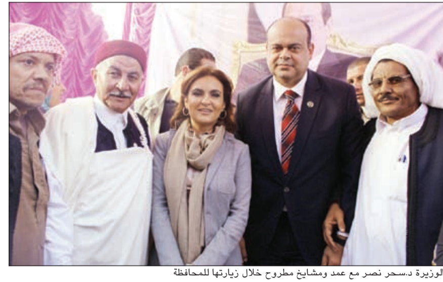
الوزيرة د. سحر نصر مع عمد ومشايخ مطروح خلال زيارتها للمحافظة

ومتوسطة لهم بالمحافظة. ومن جانبه، أكد محافظ مطروح اللواء علاء البوزيد أن زيارة الوزارة إلى العلمين، هدفاً لتحقيق البعد الخامس في عملية إزالة الألغام، وهو تنمية الأراضي وإقامة مشروعات سياحية وتنموية عليها، حتى لا يتم تركها فقام عليها مبانى عشوائية. وأشار إلى أنه تم وضع حجر الأساس لمشروع استثماري على 1300 فدان يشمل 5 فنادق وكلية خاصة ومستشفى وقسم شرطة وسينتهي بعد 7 سنوات بقيمة 14 مليار جنيه في إطار مشروع مشترك بين مصر والإمارات، يحقق 18 ألف