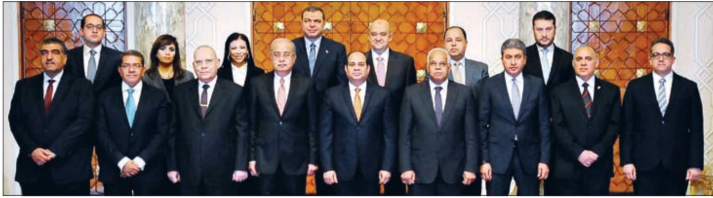
الرئيس عبدالفتاح السيسي ورئيس الوزراء مع الوزراء الجدد في التعديل الوزاري