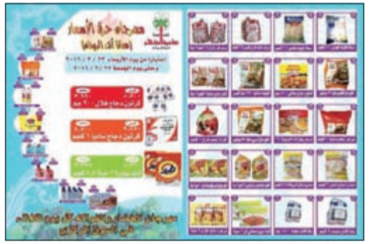
تشكيلة واسعة من السلع

غدا الجمعة آخر يوم للاستفادة من مهرجان جمعية الظهر تحت شعار «معانا أنت الربحان» حيث يتم بيع كرتون دجاج هلال 900 غ بسعر 3,990 دنانير، كرتون دجاج ساديا 1 كغ بسعر 4,500 دنانير، تايد بودرة 2 حبة 4,5 كغ بسعر 3,395 دنانير، بط دجاج مجمد 1,8 كغ بسعر 1,980 دنينار، برجر دجاج خزان 3 حبات بسعر 5,085 دنانير، بالإضافة إلى تشكيلة واسعة من السلع الأساسية والاستهلاكية.