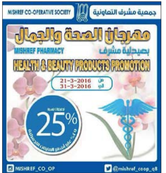
خصومات حتى نهاية الشهر في مهرجان الصحة والجمال

تشهد صيدلية جمعية مشرف مهرجانا تنافسيا للصحة والجمال يستمر حتى 31 الجاري حيث يتم بيع اصناف متنوعة بخصومات 25%، حيث يتم بيع برنغا بلان بسعر 6,085 دنانير، وسانديا زارتوكس بسعر 51,930 دنينار، بيرورين أن بسعر 19,800 دنينار، نوميرو 6,300 دنانير.