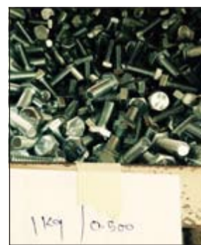
كيلو البراغي في الشويخ بنصف دينار وفي لوازم العائلة بـ 3 دنانير

خدمة المساهمين وإنما هي خلاف ذلك، مشيراً إلى أن الفرق في الجمعية يجب ألا يتجاوز الفلوس التعاونية لا أن يكون 6 أضعاف السعر.