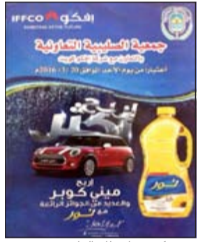
ميني كوبر بانتظار الفائزين

شوكولاتة فيوري بالكراميل 990 فلسا، شوكولاتة هابي بريك باكيت 890 فلسا، شوكولاتة المونداي 35 غ باكيت بسعر 890 فلسا، شوكولاتة بيج بريك بريك باكيت 890 فلسا. كما جرى تخفيض سعر شوكولاتة بنكرس 35 غ باكيت إلى 890 فلسا، شوكولاتة سوبا بريك 1 اصبع باكيت 890 فلسا، بسكويت تيفاني شكنوز 890 فلسا، بسكويت تيفاني مشكل 2 ربة 695 فلسا، بسكويت نيل مشكل 2 ربة 750 فلسا، إلى 890 فلسا، شوكولاتة سوبا بريك 1 اصبع باكيت 890 فلسا، بسكويت تيفاني شكنوز 890 فلسا، بسكويت تيفاني مشكل 2 ربة 695 فلسا، بسكويت نيل مشكل 2 ربة 750 فلسا، بسكويت داجيستيف 250 غ 3 حبات بسعر 690 فلسا، بسكويت تيفاني مشكل 2 ربة 1,395 فلسا، دبلايس بتر كوكيز 405 غ 695 فلسا، بسكويت شوكو كوكيز 4 حبات بسعر 895 فلسا، بسكويت كريمة مشكل 6 حبات 390 فلسا.