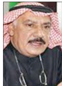
العميد عبدالرحمن الصهيل

أسفرت الحملة عن ضبط 3 مواطنين بجوزتهم 3 شوازين من دون ترخيص وكمية من ذخيرة سلاح شوزن وذخيرة رشاش كلاشكوف، إلى جانب ضبط مواطن بجوزته كمية من ذخيرة رشاش كلاشكوف، وآخر عثر بجوزته على نحو 5000 طلقة شوزن متنوعة من دون ترخيص وكما تم ضبط مواطنة