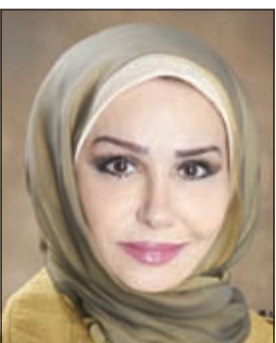
الحامية نهي الرئيس

ألزمت الدائرة 3 بمحكمة الاستئناف برئاسة المستشار عادل يوسف الكندري وزارة الصحة بأن تؤدي لمواطنة متزوجة من غير كويتي ولديها ابناء وتعمل بوزارة الصحة لها العلاوة الاجتماعية بواقع 50 دينارا شهريا عن كل ابن وذلك بالتر رجعي من تاريخ امتناع الزوج عن الإنفاق.