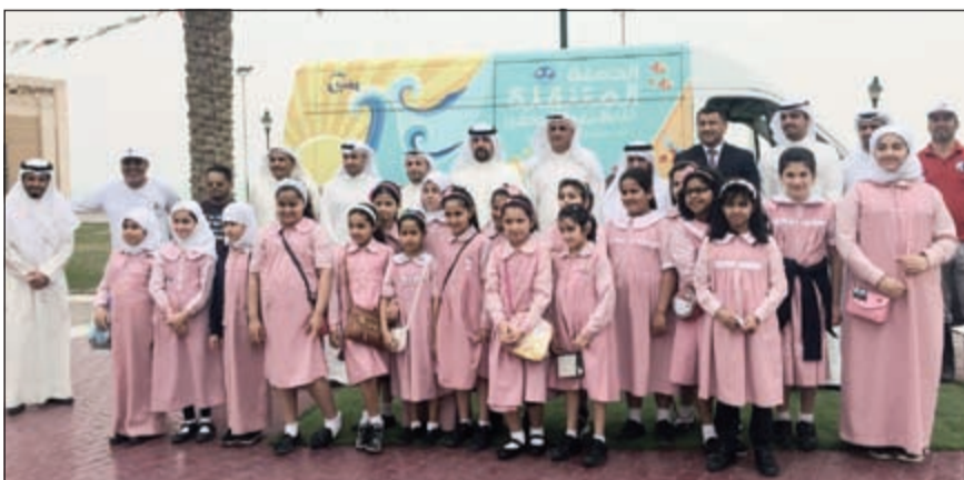
فريق العلاقات العامة في «بيتك» مع المشاركين في الحملة

السكان، واستمرراً للجهود المتواصلة التي يبذلها من أجل تعزيز وترسيخ مفاهيم الثقافة البيئية والبيئة الخضراء، والتي تعتبر من أهم دوافع ومحركات التنمية المستدامة التي يتطلع إليها المجتمع، مما يظهر ريادته في تحقيق المسؤولية الاجتماعية، وتعاونه مع المجتمع المدني بكل شرائحه وقطاعاته، للعمل على حماية الشواطئ والاهتمام بالبيئة البحرية.