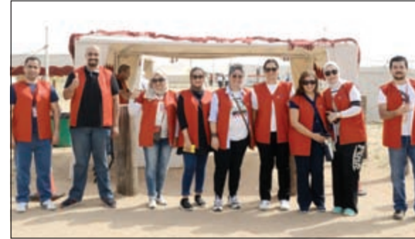
جانب من اليوم المفتوح