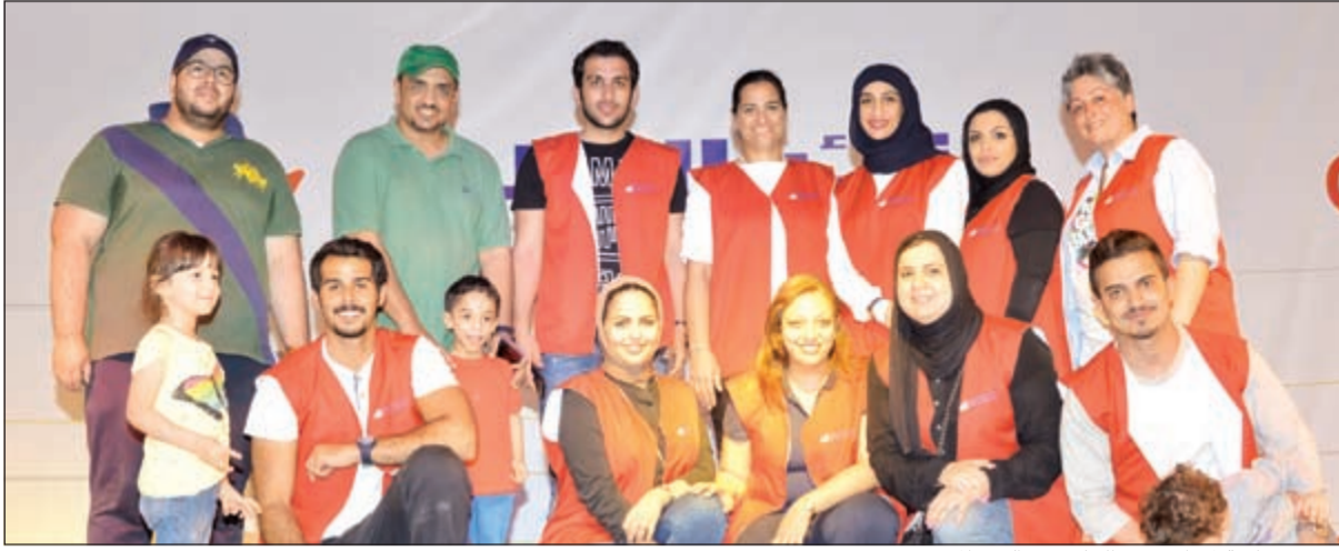
صورة جماعية لموظفي بنك الخليج في اليوم المفتوح

هذه المناسبة تعتبر جزءاً من أهداف البنك في مشاركة موظفيه وعوائلهم في يوم مليء بالمرح