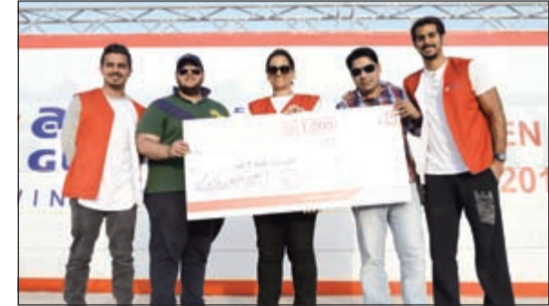
تقديم الجائزة النقدية الكبرى للفائز