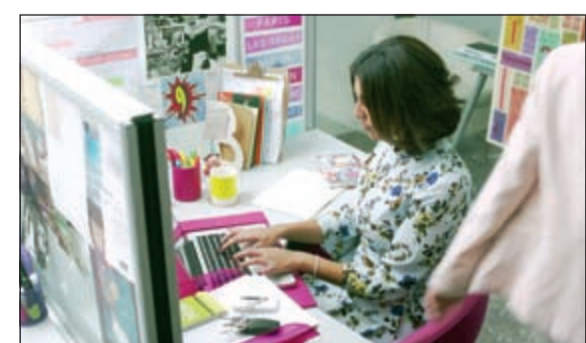
لقطات من إعلان هاوي، «نحن في كل مكان»