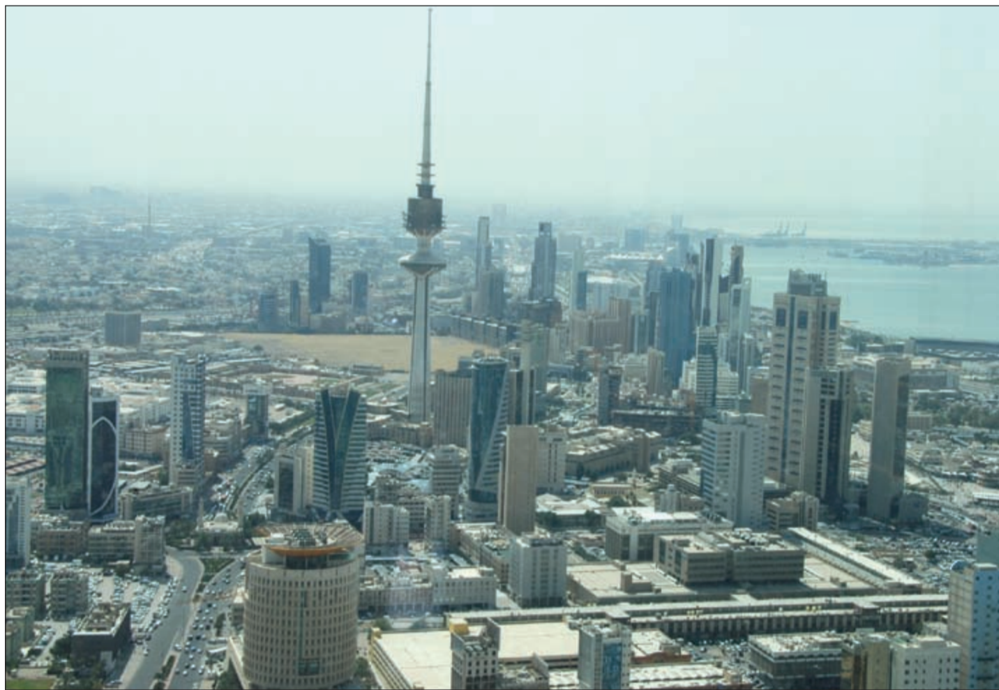
على الرغم من صرف نحو 45 ألف تأشير عمالة جديدة لمشاريع مشروع الوقود البيئي إلا أن عقاريين يؤكدون على أن استخدام هذا العدد الكبير لن يؤثر على السوق العقاري بالكويت (محمد هاشم)