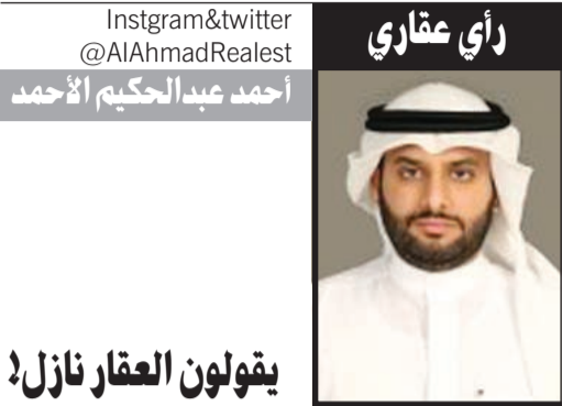
يقولون العقار نازل!