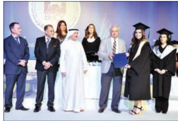
د. بدر العيسى يكرم إحدى الخريجات

بتوفير مناهج تعليمية تمكن المرأة من تحقيق الاكتفاء الذاتي ومجابهة العمل والتمتع بمهارات عالية تؤمن لها موكبة التطور والاحتياجات المستقبلية». وقال الشايحي إن البرامج المتاحة في كلية بوكسهل الكويت تعتبر مناسبة للغاية