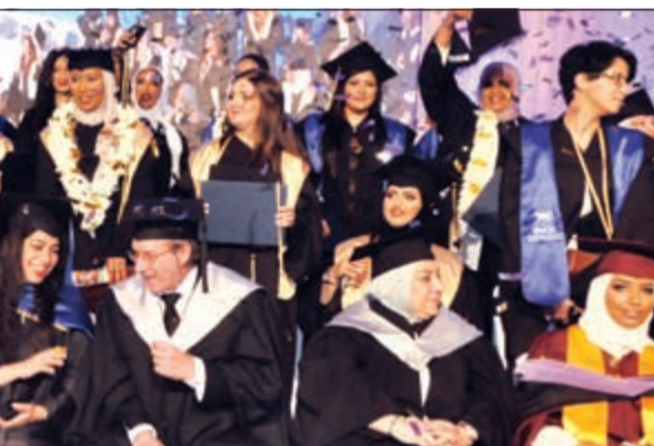
الفرحة تبدو على وجوه الخريجات

تجاه المجتمع، وحفلنا هذا العام بشهد تخريج الدفعة التاسعة من خريجاتنا العزيزات، فحنن في كلية بوكسهل الكويت ملتزمون