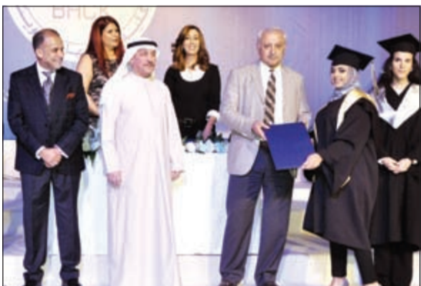
تكريم إحدى الطالبات

لاحتياجات السوق الكويتي، ويقوم بتدريسها فريق تعليمي يتمتع بخبرات عالية وفي بيئة مهية للتعليم «ونحن نشهد نموًا ملموساً لكلية بوكسهل مع تخريج هذه الدفعة من الخريجات والتي تشكل مصدر فخر لمشرفي الكلية