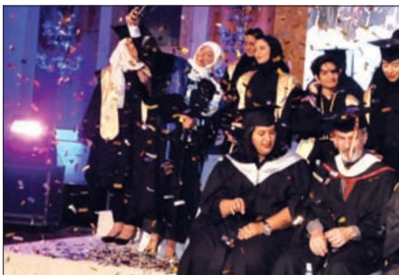
الفرحة تبدو على وجوه الخريجات

بتوفير مناهج تعليمية تمكن المرأة من تحقيق الاكتفاء الذاتي ومجابهة العمل والتمتع بمهارات عالية تؤمن لها موكبة التطور والاحتياجات المستقبلية». وقال الشايحي إن البرامج المتاحة في كلية بوكسهل الكويت تعتبر مناسبة للغاية