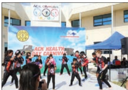
أحد العروض خلال الحفل