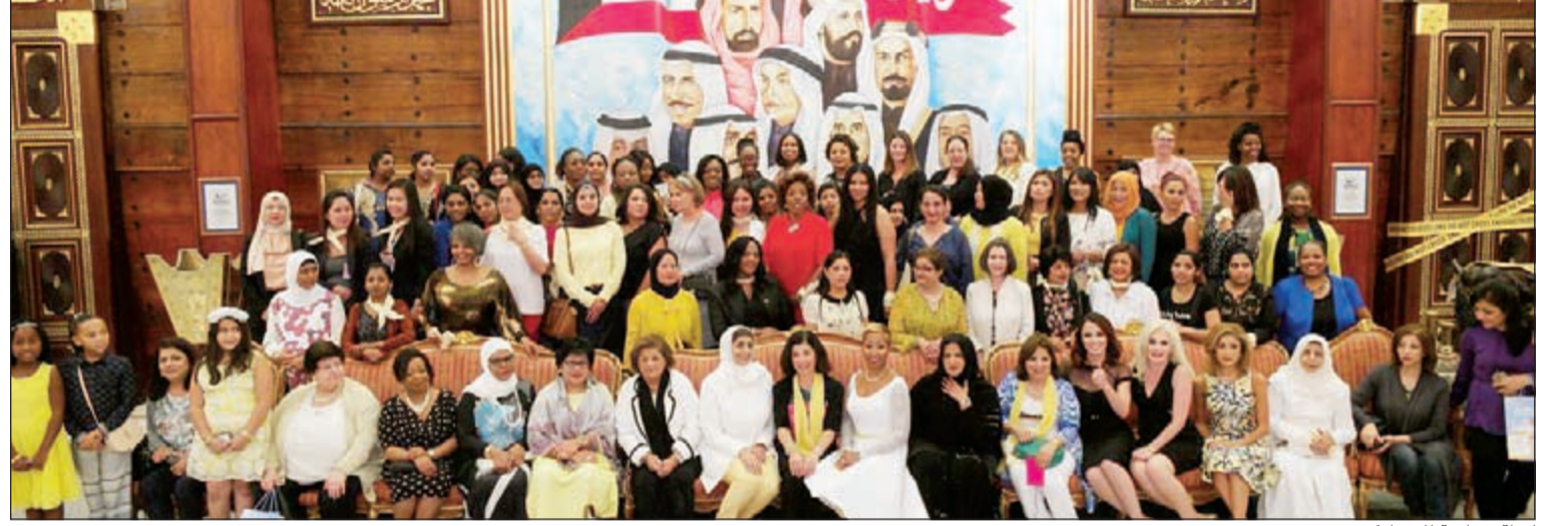
لقطة جماعية للمشاركين