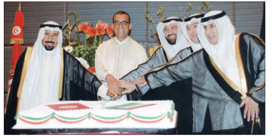
د.علي العمير ويسر ابل والسفيرعزیز الديجاني والشیخ علي الجابر والسفير التونسي يقطعون كیکة الاحتفال

أكد خلال احتفال السفارة التونسية بالذكرى الـ 60 لعيد الاستقلال أن العلاقات بين البلدين تاريخية ومتينة