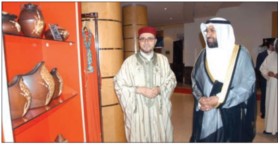
العمير يطلع على بعض مقتنيات الأثرية التونسية