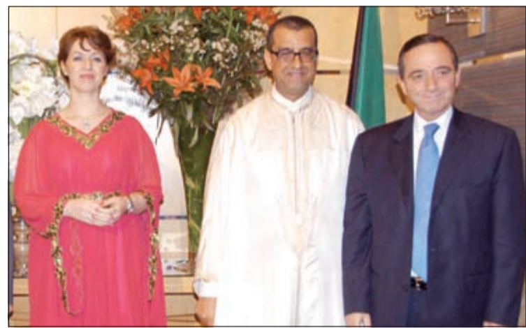
السفير الاردني محمد الكايد مبارك

بها إلى أعلى المراتب، معربا عن يقينه بأن هذا الرصيد الثري من العلاقات الثنائية وتطابق المواقف إزاء القضايا الإقليمية والدولية لن يزيد هذه العلاقات الامتعة وروسخا وتطورا.