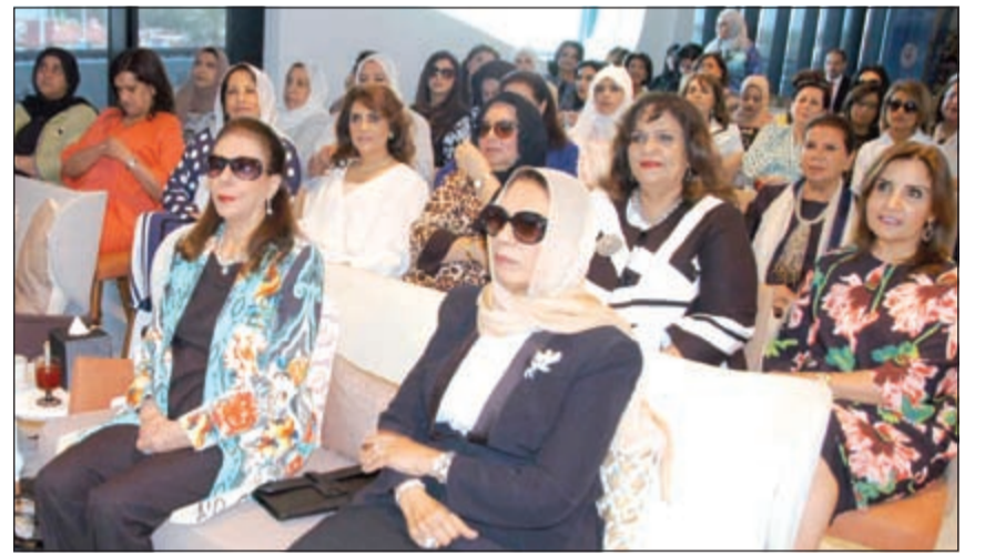
الشيخة شريفة الجاسم في مقدمة الحضور خلال الفعالية (محمد هاشم)

وأشارت العلي إلى انه منذ بدء البرنامج قبل 8 سنوات، قامت وحدة الغدد الصماء بتبني هذا النشاط من خلال تقديم محاضرات صحية توعوية شملت مرض هشاشة العظام، وسبل الوقاية والكشف عن المخاطر الصحية لكل مرحلة عمرية من حياة المرأة، وسمتها بعد سن الأربعين، بالإضافة إلى كسور العمود