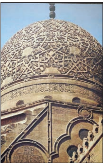
مسجد السلطان قابيل بالقااهرة