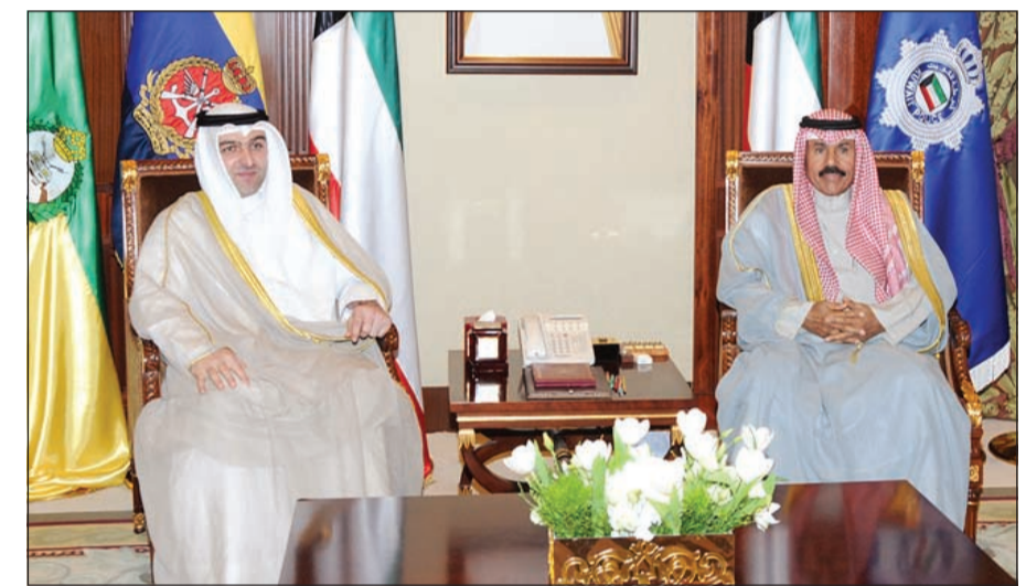
سمو ولي العهد الشيخ نواف الاحمد مستقبلا ياسر ابل

د.يوسف العلي، حيث قدم لسموه الوكيل المساعد للشؤون القانونية بوزارة التجارة د.محمد الجلال السهلي والوكيل المساعد لشؤون الرقابة التجارية وحماية المستهلك بوزارة التجارة عبد الرشيد، وذلك بمناسبة تعيينهما في منصبيهما الجديدين.