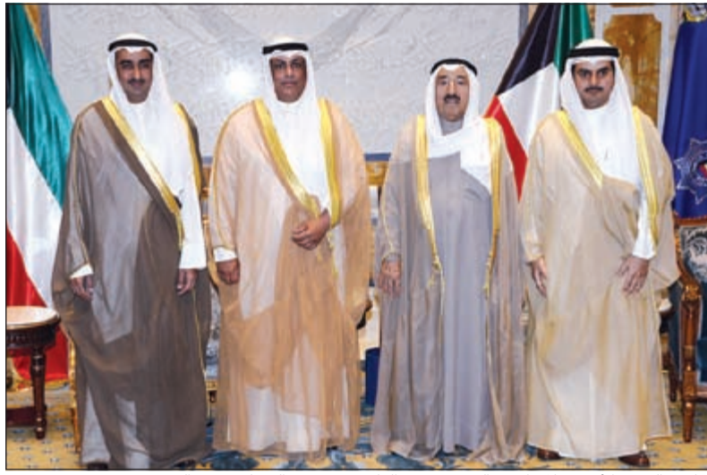
صاحب السمو الامير خلال استقباله د. يوسف العلي ود. محمد السهلي وعبد الرشيد