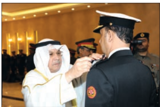
وزير الدفاع خلال تقليد أحد الضباط رتبته