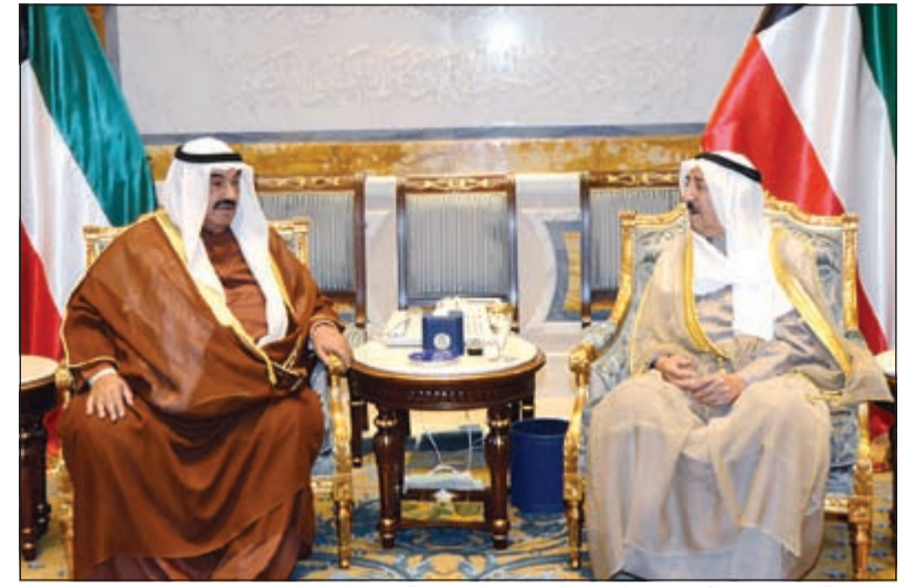
صاحب السمو الامير الشيخ صباح الاحمد مستقبلا سمو الشيخ ناصر المحمد

الصحة وائل أبو فاعور وذلك بمناسبة زيارتهما للبلاد. وحضر المقابلاتين المستشار بالديوان الاميري الفريق خالد عبدالله بوذي والمستشار بالديوان الاميري خالد يوسف الفليح.