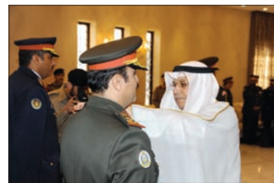
الشيخ خالد الجراح مقلدا أحد الضباط رتبته

في المنطقة البحرية الواقعة شرق رأس الجليعة من الساعة السادسة صباحا وحتى الساعة الرابعة عصرا. وقالت مديرية التوجيه المعنوي والعلاقات العامة بوزارة الدفاع إن موقع ميدان الرماية سيكون في المنطقة البحرية الواقعة شرق رأس الجليعة بمسافة 16,5 ميلا بحريا امتدادا لجزيرة قارو وبمسافة 6 أميال بحرية شرق رأس السزور امتدادا لجزيرة أم المرادم.