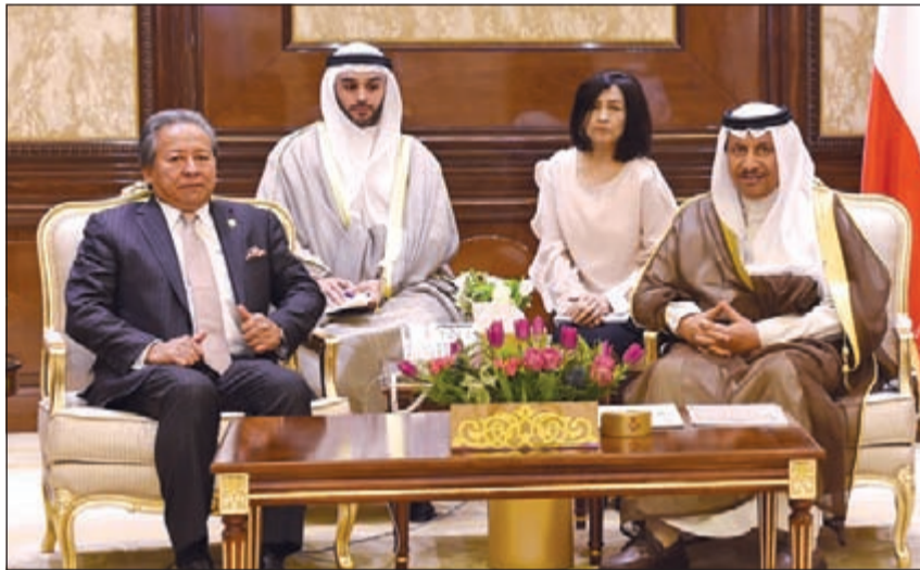
سمو رئيس الوزراء الشيخ جابر المبارك مستقبلا وزير خارجية ماليزيا

أنيفة حاجي أمان والوفد المرافق له وذلك بمناسبة زيارته للبلاد. حضر المقابلة سفيرنا لدى ماليزيا سعد العسوس. واستقبل سمو رئيس مجلس الوزراء الشيخ جابر المبارك في قصر بيان امس رئيس الحزب التقدمي الاشتراكي في الجمهورية اللبنانية الشقيقة النائب وليد جنبلاط والوفد المرافق له وذلك بمناسبة زيارته للبلاد. حضر المقابلة المستشار بالديوان الاميري خالد الفليح ومساعد وزير الخارجية لشؤون الوطن العربي السفير عزيز الدحياني.