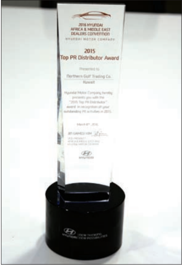
جائزة «شمال الخليج»

والتي جانب تفوقها وإنجازاتها المتتالية في كافة المجالات، تطرح شمال الخليج بشكل دوري باقة متجددة من العروض التجارية بهدف إرضاء العملاء ومنحهم فرصة امتلاك هيونداي بأسعار مميزة وسهلة، وأيضاً بهدف المساهمة في تعزيز صورة «هيونداي» كسيارة ناجحة وعلامة تجارية استطاعت بوقت قصير منافسة أقدم شركات السيارات وأكثرها عراقية، ووفاء لفلسفة «هيونداي» التي تضع حاجات العملاء على رأس قائمة أولوياتها سواء قبل البيع أو بعده.