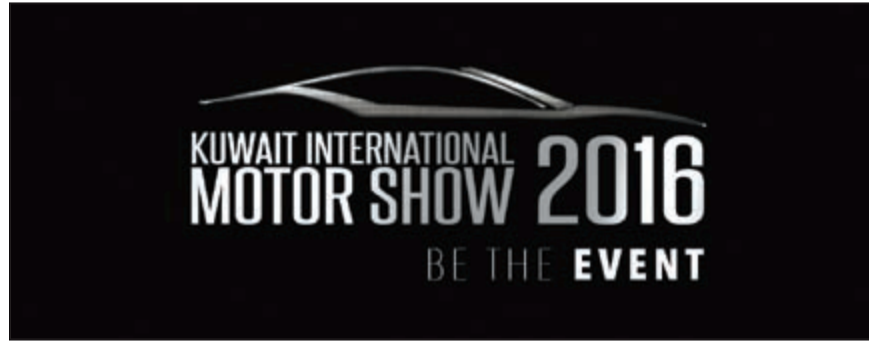
شعار معرض الكويت الدولي للسيارات