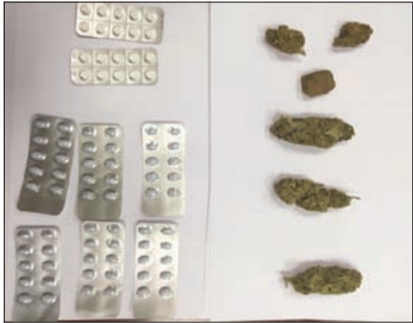
المضبوطات احيلت الى «المكافحة»

أحال رجال جمرك المطار الى الادارة العامة لمكافحة المخدرات وأفاد اوروبيا تهمة لإحالة الى النيابة العامة بتهمة جلب مواد مخدرة، وجاء هذا الاجراء بعد ان ضبط رجال جمارك مطار الكويت الدولي صالة «القادمون» الوافد عقب قدومه وفي حوزته تهريب 6 قطع ماريغوانا و100 حبة مخدرة، هذا وقد أشرف على الضبطة مراقب جمارك مطار عيسى بن عيسى وقد تمت إحالة المتهم مع المضبوطات الى جهات الاختصاص.