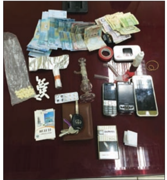
مخدرات وجيوب والوراء تعاط ضبطت مع مواطنة في مبارك الكبير

وواصل قطاع الأمن العام جهوده المتواصلة على مدار الساعة لضبط الأمن وملاحقة الخارجين على القانون دون غض البصر عن الهم المروري المتعلق بضبط المستهترين وغير المرغبين بقواعد وأنظمة المرور. كما أسفرت حملات الأمن العام والتي جاءت بإشراف ميداني ومتابعة الكثير منها من قبل وكيل وزارة الداخلية المساعد