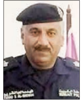
اللواء فهد الشويخ

مدير عام الإدارة العامة للمرور لشؤون تنظيم السير والرخص للواء فهد الشويخ الى عموم قوة وزارة الداخلية خاصة المرور والنجدة والأمن العام بأن ترفق مخالفة عدم الانتباه الى مخالفة التحدث في الهاتف خاصة لأشخاص يكونون غير منتبهين او منهمكين في التحدث والإنشغال بالهاتف خلال القيادة.