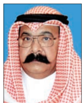
اللواء محمود الطباح

تعدد قضايا السلب بالاكره في الفروانية خاصة تلك التي تستهدف نسوة في الفروانية وفي الغالب تكون عبارة عن سلب شنط يدوية وبالقوة ويصاحب طريقة السلب تلك بالسلب، وهذا ما دفع مدير عام الادارة العامة للمباحث الجنائية العميد محمود الطباح الى تشكيل فريق عمل من قبل رجال مباحث الفروانية. وقال مصدر اميني اسفر الانتشار المنظم لرجال مباحث الفروانية خاصة في فترة ما بين الغروب والعشاء عن رصد شاب يستقل دراجة نارية من دون لوحات وانه ترك الدراجة في احد الشوارع ومن ثم تم تتبعه ليجد