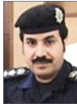
العقيد ناصر العدواني

كما تم التعامل مع 104 حوادث مرورية. وفي الفروانية وتحت اشراف مدير امن الفروانية اللواء ركن صالح العنزي تمت اقامة 6 حملات أسفرت عن ضبط بنغلاديشي مخمور ومتغيبين ومخالفين للإقامة. وإلى حوالي وتحت اشراف مدير امن حولي