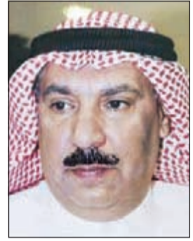
العميد عبدالرحمن الصهيل

تجديد التراخيص لها. وقال العميد الصهيل في تصريح خاص لـ «الأبناء»: اضطررنا الى اتخاذ هذا الاجراء والمزمع تطبيقه خلال الأيام المقبلة عقب تجاهل عدد ليس بقليل من دعواتنا تسليم الأسلحة التي بحوزتهم أو تجديد ترخيصها، لافتا الى ان القانون لا يعطي اي شخص يجوز سلاحا وانتهت رخصته أي ميزة ويعتبر السلاح الذي بحوزته ومع انتهاء رخصة السلاح له كالعادم، وبالتالي