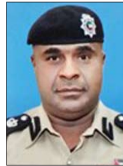
العميد عبدالله سفاح

اللواء ركن شهاب الشمري تمت إقامة 3 حملات أسفرت عن ضبط مدينين ومتغيبين 26 مخالفا وتحرير 113 مخالفة مرورية. وفي الاحمدي وتحت اشراف العميد عبدالله سفاح تمت اقامة عدة حملات أسفرت عن ضبط مطلوبين ومطلوبات لأحكام جنائية ومدينين ومن بين المدينين مواطن مطلوب لـ 140 ألف دينار ومواطن مطلوب للسجن 10 اعوام ومركبة مسروقة. وفي الجهراء تم ضبط مركبة مسروقة ومطلوبين والنساء يتعرضن للاصابة عادة واذ ما احكمت السيدة المقتهمة الامسك بشنقتها يقومون بسحلها أي انهم يكون لديهم اصرار على السلب مهما كلفهم ذلك، هذا وتبين ان اغلب المسروقات يقوم المتهمون بانفاقها على التدخين وشراء الجيوب والاطعمة.