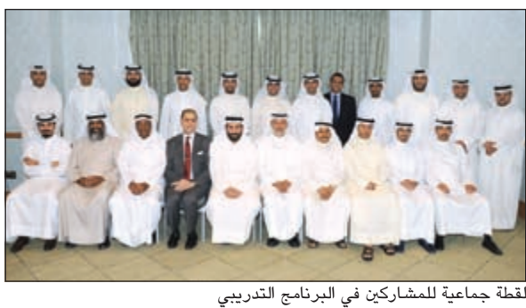
لقطة جماعية للمشاركين في البرنامج التدريبي

تنظمت شركة أعيان العقارية بالتعاون مع شركة بكرة تلي - الكويت برنامجاً تدريبياً بعنوان «ديناميكيات عمل مجلس الإدارة واللجان المنتدبة عنه» في فندق كورت يارد ماريوت - الراجية ضمن برنامجها التدريبي المعتمد للمساهمين والجهات الرقابية. ويأتي تنظيم هذا البرنامج في إطار الجهود المبذولة من الشركة لضمان التطبيق الأمثل لكل متطلبات وقواعد حوكمة الشركات وفقاً للائحة التنفيذية للقانون رقم 7 لسنة 2010 بشأن إنشاء هيئة أسواق المال وتنظيم نشاط الأوراق المالية وتعديلاته وقانون الشركات رقم 1 لسنة 2016، وذلك من خلال تزويد المشاركين بأهم المعارف المطلوب أن يتمتع بها عضو مجلس الإدارة وما يترتب على عضويته