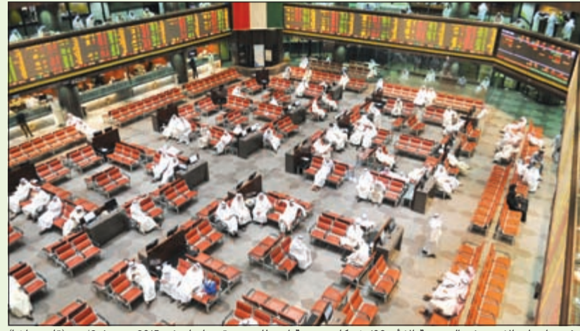
رغم تراجع الاسهم في البورصة الا ان 109 شركات مدرجة استطاعت تحقيق ارباح في 2015 بنمو 72,4% (قاسم باشا)

ذكر تقرير الشال ان 109 شركات تمثل 57,4% من اجمالي عدد الشركات المدرجة، البالغ 190 شركة، أعلنت نتائج أعمالها، للسنة المنتهية في 31 ديسمبر 2015، وحقق أرباح بنحو 1,356 مليار دينار، بارتفاع بلغ نحو 2,4%، عن مستوى أرباح نفس الشركات في عام 2014 البالغة نحو 1,324 مليار دينار.