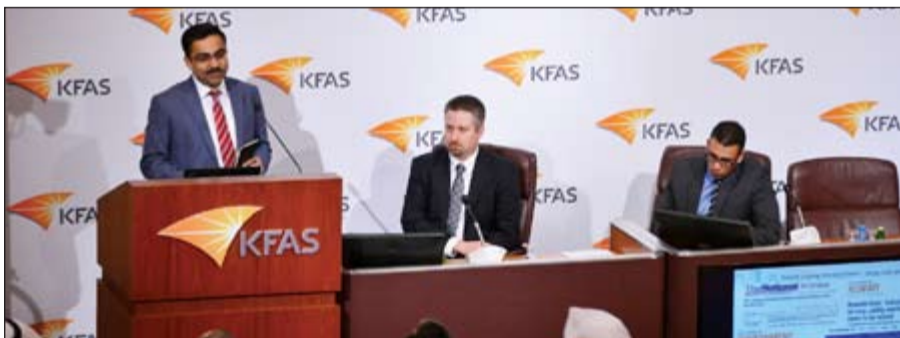
جانب من الحضور في الندوة