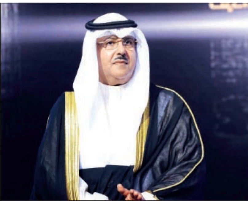
رئيس وفد الكويت الشيخ فهد المبارك في حفل الختام

حقق وفد الكويت برئاسة الوكيل المساعد لشؤون قطاع الإذاعة الشيخ فهد المبارك الصباح المشوارك في مهرجان الإذاعة والتلفزيون بدورته الرابعة عشرة والذي اختتمت أنشطته أمس الأول بمملكة البحرين الشقيقة بحضور وزير شؤون الإعلام البحريني علي الرميحي 12 جائزة منها ذهبية وفضية وبرونزية ووسط منافسة قوية بين المحطات الخليجية الحكومية والخاصة والجوائز الإذاعية هي «مسلسل علي بابا ذهبية، مسلسل سواها البخت ذهبية، برنامج ملك الغرام فضية، برنامج من قصص القرآن ذهبية، برنامج تقدر فضية». أما جوائز التلفزيون فهي «مسلسل تورا بورا ذهبية، مسلسل لمحات