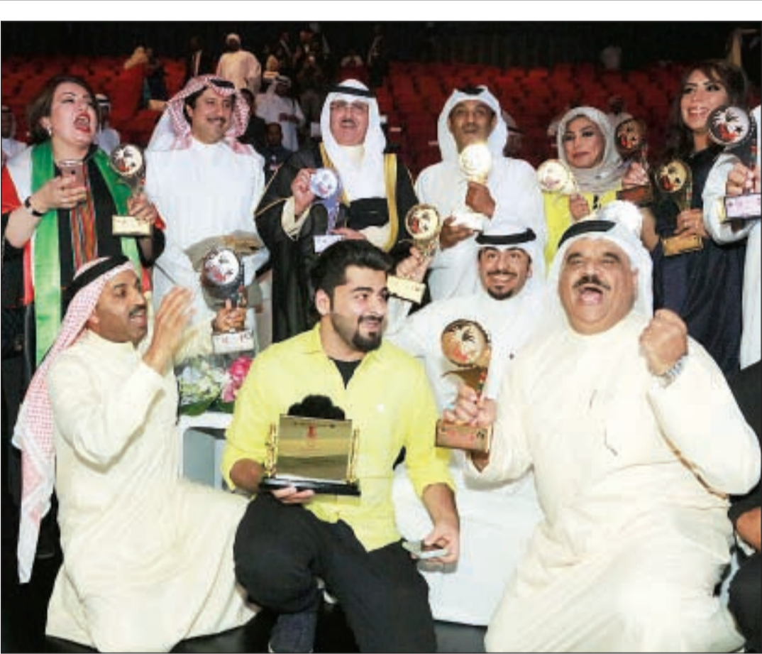
فرقة جماعية للوفد الكويتي بجوائزهم مع نجوم الفن داود حسين وطارق العلي ومنى شداد