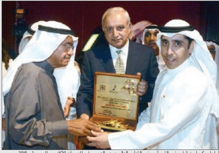
الراحل مكرم من قبل وزير التربية ووزير التعليم العالي د.بدر العيسى في المهرجان الاكاديمي للموسيقى 2015