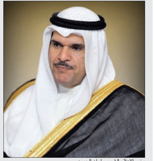
وزير الإعلام الشيخ سلمان الحمد