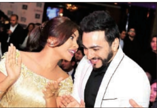
شيرين وتامر حسني

ويعد الحفل الأول لشيرين عبدالوهاب بعد تراجعها عن قرار اعتزالها الذي أعلنته مؤخرا.