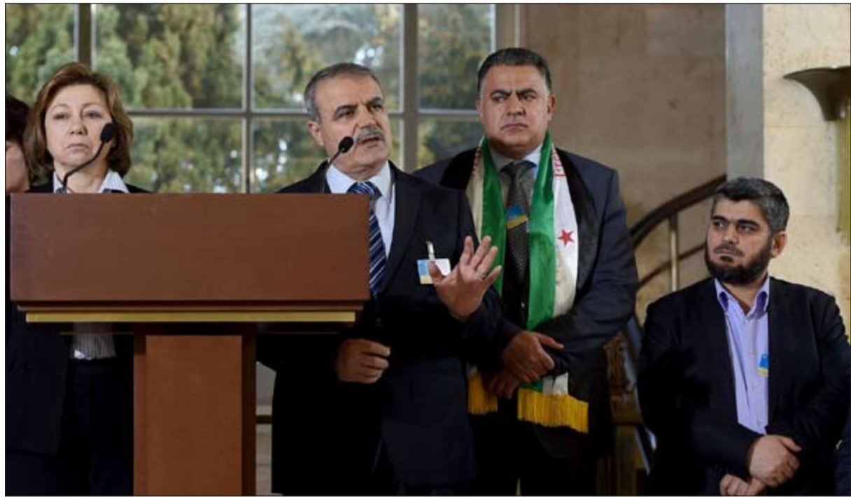
وفد المعارضة السورية خلال مؤتمر صحفي عقب محادثاته مع ديمستورا في جنيف امس

وأضاف ديمستورا في تصريح صحفي في ختام الأسبوع الأول من المباحثات السورية - السورية أن الوفد السوري الحكومي عليه عدم الاكتفاء بتناول مبادئ عملية السلام بل الانتقال إلى مقترحات عملية. وأوضح ديمستورا أن هناك ثلاثة ملفات مهمة مطروحة على الوفد الحكومي السوري وتتعلق بإدخال المساعدات الإنسانية إلى المناطق المحاصرة وبحث مصير المعتقلين السياسيين والمختطفين والأسرى لدى الجماعات المسلحة ثم آلية الانتقال السياسي وفق رؤية دمشق لتطبيق قرار مجلس الأمن 2254. وأشار إلى أنه «تلقي على ورقة تفصيلية من المعارضة بشأن رؤيتها، فيما الحكومة لاتزال تركز على المبادئ»، كاشفاً أنه «سيستبع نهما تفصيليا في الجولة التالية».