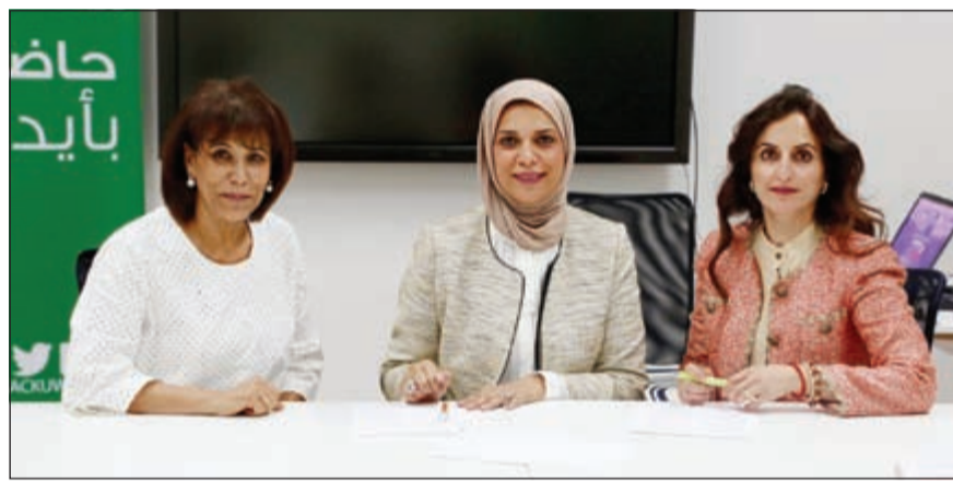
جانب من توقيع اتفاقية التعاون بين «لويك» و«نولج» للاستشارات

وقعت منظمة لويك اتفاقية تعاون مع شركة «نولج» للاستشارات في مجال التدريب لخدمة الفئة الشبابية التي تستفيد من برامج التدريب التي تقدمها لويك.