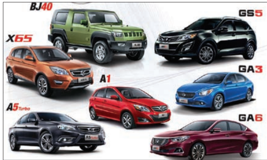
من سيارات «المطوع والقاضي»

أعلنت «مجموعة المطوع والقاضي» وشركاتها التابعة عن رعايتها لمعرض العطور وأدوات التجميل ومعرض الساعات الذي تقيمه وتنظمه شركة معرض الكويت الدولي في الفترة من 23 مارس الجاري ويستمر حتى 2 أبريل المقبل تحت رعاية وكيل وزارة التجارة والصناعة خالد الشمالي، في الصالة 5، 6، 7 على أرض المعارض الدولية بمشرف.