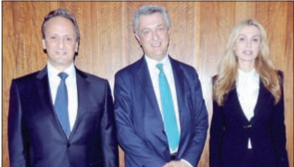
مفوض الأمم المتحدة السامي لشؤون اللاجئين فيليبو غراندي مع سفيرنا لدى الولايات المتحدة الشيخ سالم العبدالله وحرمة الشبيخة ريم الصباح

في مايو المقبل للمرة الأولى منذ تسلم مهامه كمفوض سام لشؤون اللاجئين في يناير الماضي بعد ان شغل منصب المفوض العام لوكالة الأمم المتحدة لإغاثة وتشغيل اللاجئين الفلسطينيين (أونروا) انه «سعيد للغاية» لزيارة الكويت ومقابلة المسؤولين وأعضاء الحكومة الكويتية الذين تجمعهم معه «علاقة وطيدة». كما أشاد المسؤول الأممي بجهود الشبيخة ريماء وعطاءتها كونها سفيرة للنوايا الحسنة لمفوضية الأمم المتحدة لشؤون اللاجئين منذ