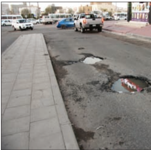
إحدى الحفر التي عاينها الوزير

وأرجع الخنفور تأخير المشاريع وتردي الطرق إلى انه متعمد وعدم مبالاة من العاملين في الوزارة، واصفا الكثير منهم بأنهم لا يتقيدون بالبرنامج الزمني المعد لكل مشروع، ورغم ذلك امتدح الخنفور الوزير العمير، واصفا إياه بأنه من الوزراء الذين يعملون ولا يرضى بتأخير أي أمور لا تخدم المواطن، أخذا أمام عينه مصلحة الوطن والمواطن من أولوياته. وزاد بأن الجولة شملت عددا من مناطق المحافظة للاطلاع على مشاكل الطرق، لافتا إلى أن الوزير العمير وعد بحل هذه المشاكل خلال فترة زمنية مدتها أربعة أشهر. وأضاف أنه ستكون هناك زيارة أخرى بعد أربعة أشهر لتتأكد من إنجاز العمل، مشددا على ضرورة محاسبة الشركات غير المنجزة.