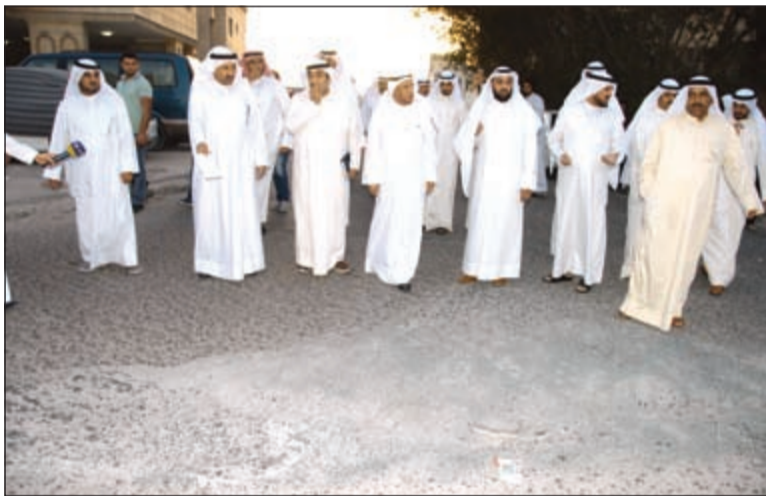
جانب من الجولة