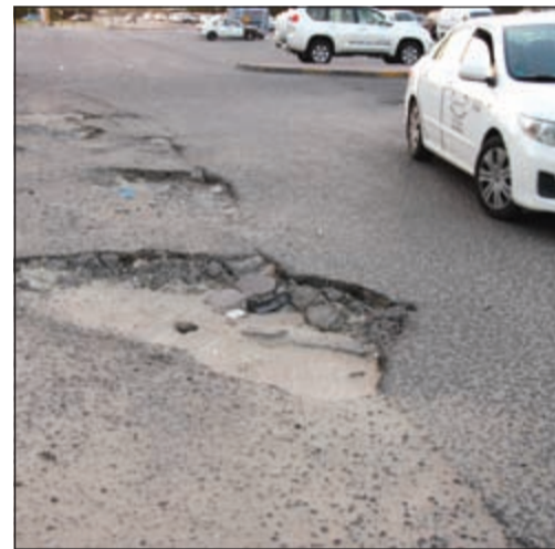
من مشكلات الطرق في المحافظة

خلفية تأخير تنفيذ مشاريع الطرق والصيانة والبنية التحتية في منطقة الفروانية ومناطقها، مؤكدا أن هذا ما هو إلا استخفاف وإهمال بحق أبناء هذه الدائرة الذين يعانون الويل من الإهمال شسبه المتعمد من