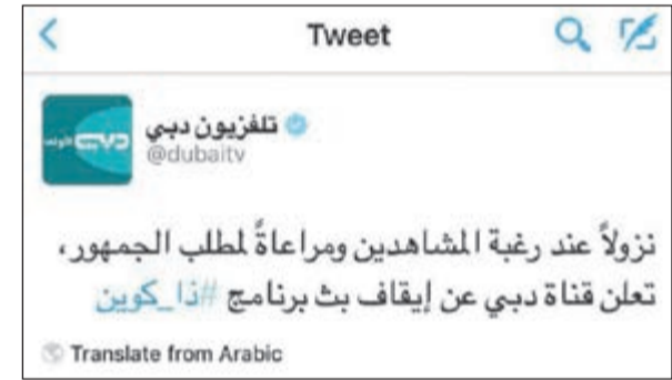
تغريدة تلفزيون دبي على موقع «تويتر»