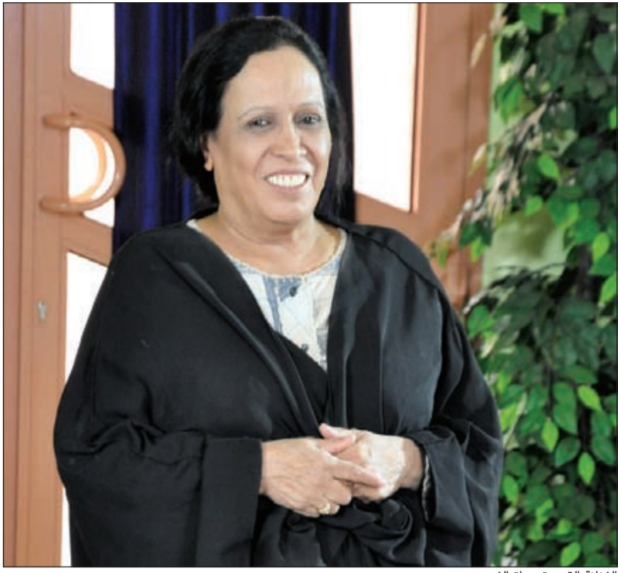
الفنانة القديرة حياة الفهد

سيكون من نجوم الساحة الغنائية الخليجية والعربية واسمه سيكون مفاجأة للجميع.